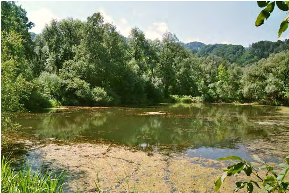
Abbildung 5: Ufer- und Schwimmblattvegetation in den alten Baggerlöchern neben dem Alten Rhein bei Oberdorf.

In allen drei Gewässern kann eine Zonierung der Vegetationszonen beobachtet werden. Auf eine submerse Moos- und Algenvegetation folgt eine ausgeprägte Schwimmblattvegetation, in der vor allem das Ährenausendblatt ( Myriophyllum spicatum ) und das Kamm-Laichkraut ( Potamogeton pectinatus ) dominieren. Weiters bilden der Tannenwedel ( Hippuris vulgaris ) und der große Wasserschlauch ( Utricularia australis ) einen schönen Aspekt. Stellenweise sind schmale Röhrichte mit Großem Schwaden ( Glyceria maxima ) zu finden. An den Uferbereichen des mittleren Weihers ist auf kleinen Schotterflächen das vom Aussterben bedrohte Sumpf-Nadelried ( Eleocharis acicularis ) zu finden. Im Süden bildet ein schmaler Silberweidenauwald ( Salicetum albae ) die Grenze zum Alten Rhein. Das Biotop ist reich strukturiert und bildet den Lebensraum für eine reichhaltige Fauna.