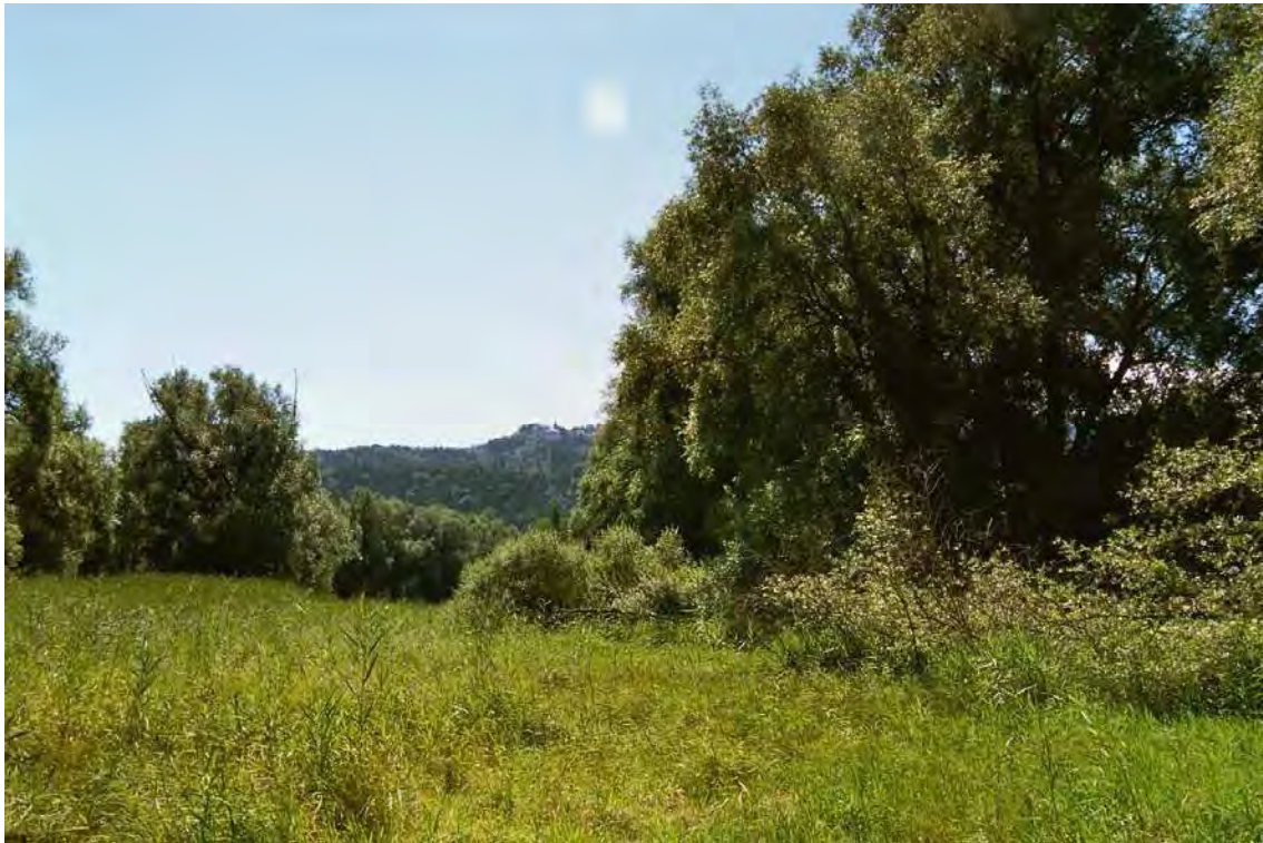
Abbildung 6: Weißweidengaleriewälder des Eselschwanz.

Langgestreckter Galeriewald entlang des Alten Rheins mit altem, stattlichem Baumbestand, der in Teilen jedoch stark anthropogen geprägt ist (eingebrachte Fichten, Föhren und Lärchen). Der Wald stockt auf einem alten Damm. Diesem vorgelagert befindet sich eine ausgedehnte Großröhricht-Fläche mit Wasserschwaden und Schilf und einzelnen alten Weißweiden am Ufer zum Fluss. Der Galeriewald liegt im Osten von Gaißau. Kleine Teile des Bestandes reichen bis in die Gemeinde Höchst. Das Biotop wird westlich durch die Landesstrasse L19 bzw. einen asphaltierten Radweg und östlich durch einen alten Blockwurf abgegrenzt. Die Fläche ist vor allem aufgrund ihres positiven Beitrags zum Landschaftsbild und durch ihre Pufferwirkung für die Bereiche des Alten Rheins erhaltenswert.