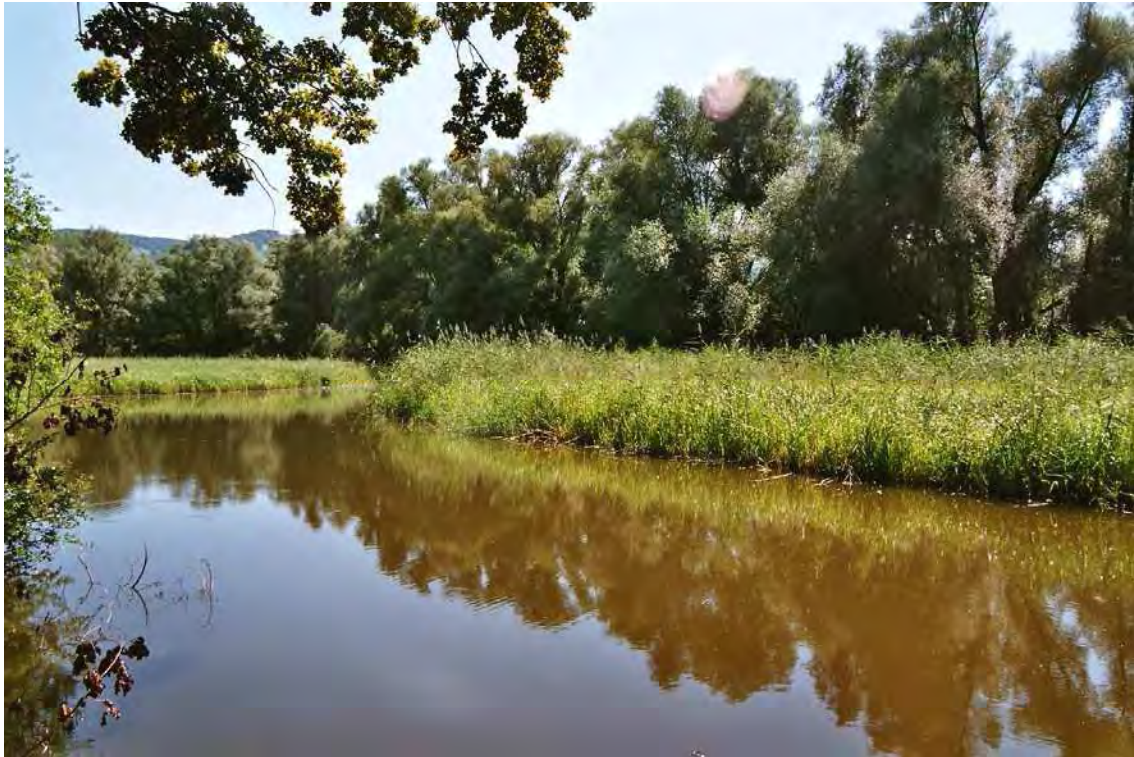
Abbildung 4: Verlandende Restwasserseen des Alten Rheins.

Das an der Ostseite des Alten Rheines gelegene, lang gestreckte Biotop wird von 3 kleinen Restwasserseen des ehemaligen alten Rheinlaufs gebildet. Sie entstanden allmählich nach dem Bau von Buhnen, die bereits in den 30-er Jahren angelegt worden sind. Nach dem Rheindurchstich um 1900 bei Fußach verlandete der Alte Rhein allerdings zusehends. Die hier behandelten Restwasserseen zeigen eine gut ausgeprägte Vegetationszonierung bzw.. weisen unterschiedliche Stadien der Verlandungssukzession auf. Offene Wasserflächen werden von submersen Algen- und Moosbeständen, dichten Beständen der Kleinen Teichlinse ( Lemna minor ) oder von Schwimmblattvegetation mit Arten wie dem Tannenwedel ( Hippuris vulgaris ), dem Großen Wasserschlauch ( Utricularia australis ) und der Weißen Seerose ( Nymphaea alba ) eingenommen. Umgeben werden die Wasserflächen von ausgedehnten Röhrichten, die vor allem von Großem Wasserschwaden ( Glyceria maxima ) und Schilf ( Phragmites australis ) aufgebaut werden. Etwa ein Drittel der Fläche wird von einem Galeriewald eingenommen, der als Weißweidenau ( Salicetum albae ) anzusprechen ist. Dieser Bereich zeichnet sich durch sehr alte und große Bäume aus, die jedoch nur einen schmalen Streifen hin zum alten Rhein bilden. Das Biotop ist aufgrund seines Strukturreichtums aus zoologischer Sicht sehr bedeutsam.