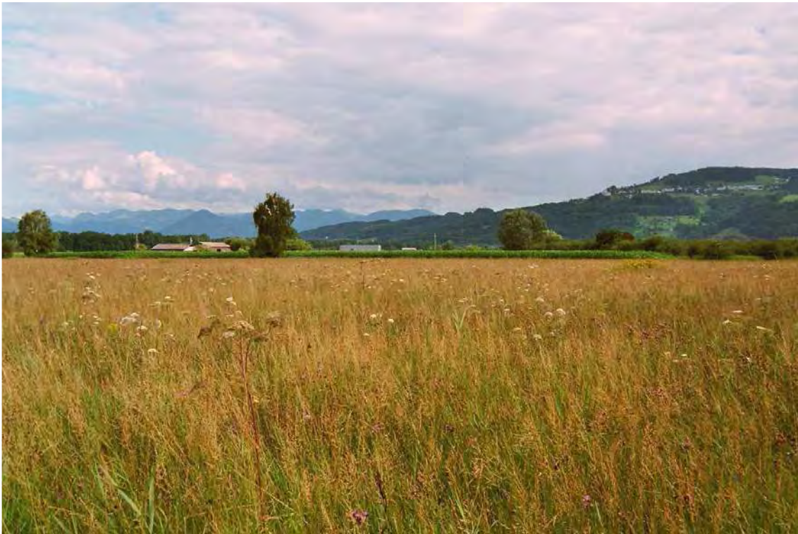
Abbildung 3: Blick über die Streuwiesen des Gaisbauer Rieds.