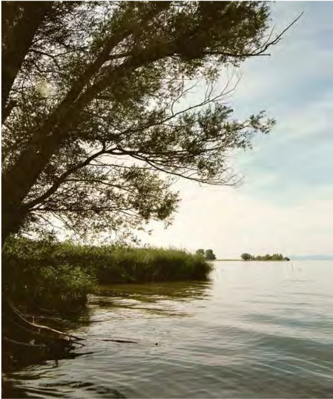
Abbildung 2: Röhrichte und Auwälder am Rheinspitz.