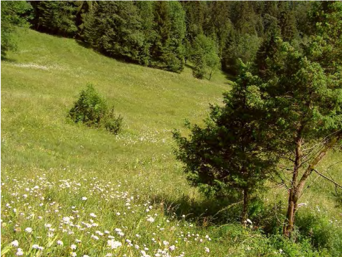
Abbildung 6: Blick über den SW-Teil der Hangflachmoor unterhalb der Trägerhöhe; im Vordergrund Wacholdersträucher.