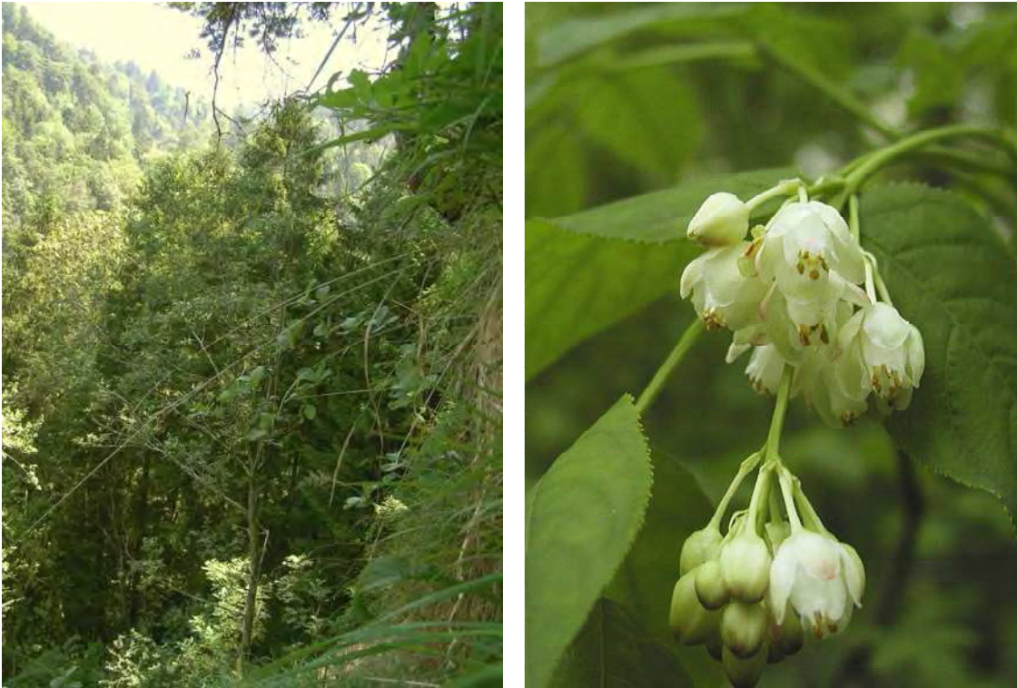
Abbildung 4: Die wärmeliebenden Wälder des Ruggbergs mit ihrer artenreichen Strauchschicht. Rechts die seltene Pimpernuss ( Staphylea pinnata ). Links Blick vom Föhren-Steilhangwald in die Schlucht des Ledenbaches unterhalb Lutzenreute.