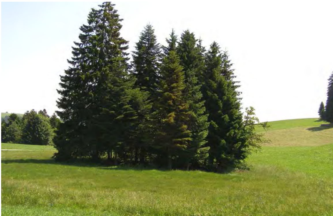
Abbildung 7: Das Letzemoos ist ein kleines, besonders sch6tzenswertes Moor mit Zwischenmoorcharakter.

Die Vegetation entspricht je nach Wasserversorgung einer zwergstrauch- und pfeifengrasreichen “Moorheide“ oder einem Kleinseggenried vom Typ des Brauseggenmoor ( Caricetum goodenowii ). Aufgrund der Muldenlage und der Umrahmung mit stark ged6ngten Intensivwiesen zeigen die Randbereiche des Moors Beeintrachtigungen durch Nahstoffeintrag; die moortypischen Nahstoffmangelspezialisten bleiben dementsprechend weitgehend auf das Zentrum des Bestandes beschrankt. Die Einrichtung einer Pufferzone um das Moor ware dringend angebracht. Trotz der Beeintrachtigungen ist das Moor auch aufgrund der geomorphologischen Position aber nach wie vor sehr sch6tzenswert.