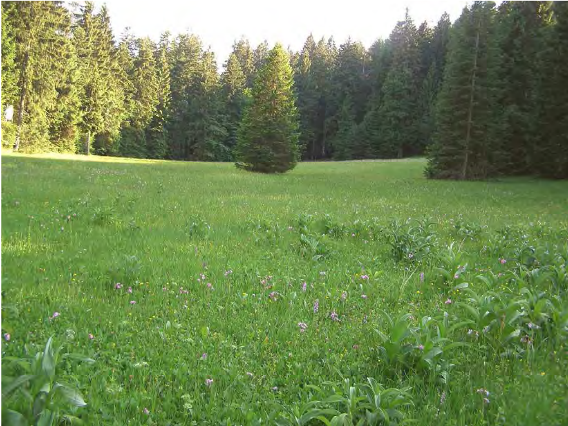
Abbildung 3: Saure Pfeifengraswiesen, Braunseggenmoore und Zwischenmoore mit Draht-Segge im Bereich einer Hangverebnung bei Hub.