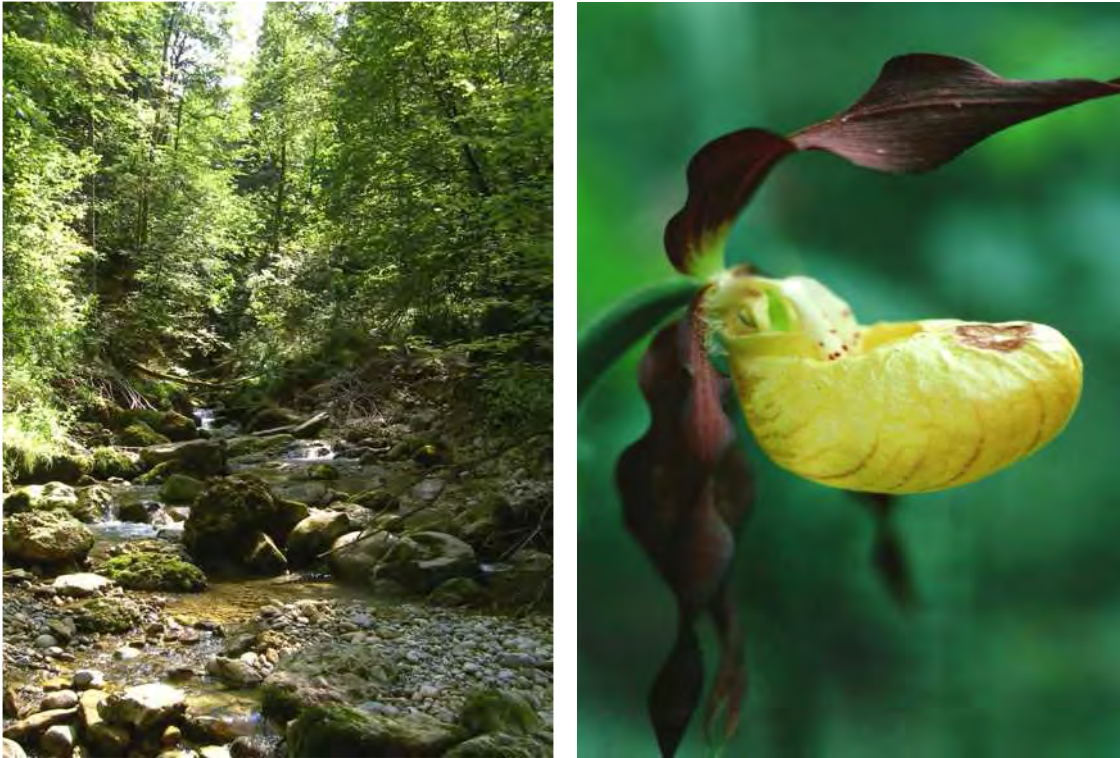
Abbildung 5: Blick in die Kesselbachschlucht bachaufwärts unterhalb Ochsenhorn; rechts der in lichten Wäldern vorkommende Frauenschuh ( Cypripedium calceolus ).