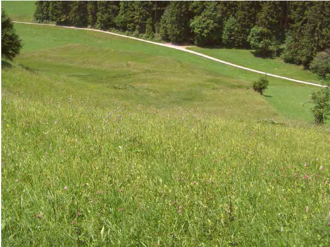
Abbildung 2: Magere Goldhaferwiesen und Hangmoore an den Abhängen östlich Lutzenreute, Parzelle Mühle.