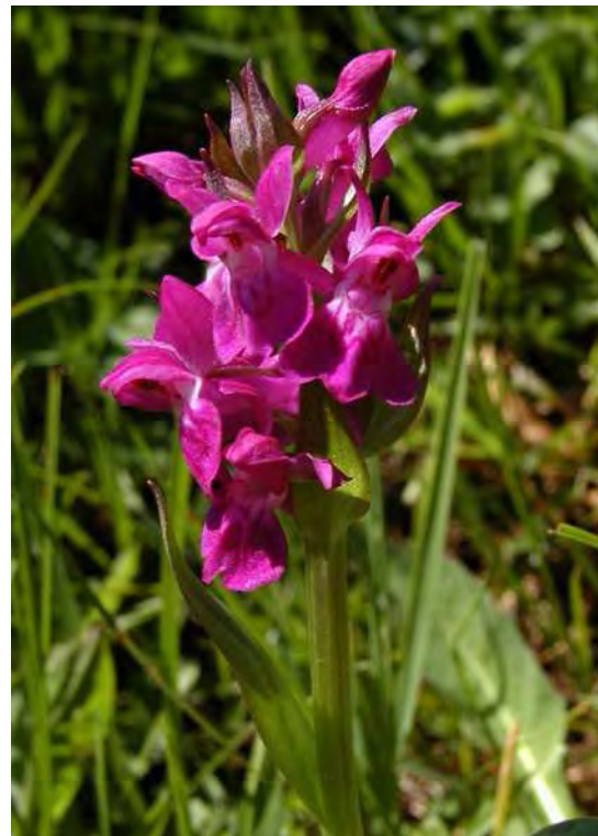
Abbildung 8: Die beiden für Flachmoore typischen Orchideenarten Sumpf-Stendelwurz ( Epipactis palustris ) links und Breitblättriges Fingerknabenkraut ( Dactylorhiza majalis ) rechts