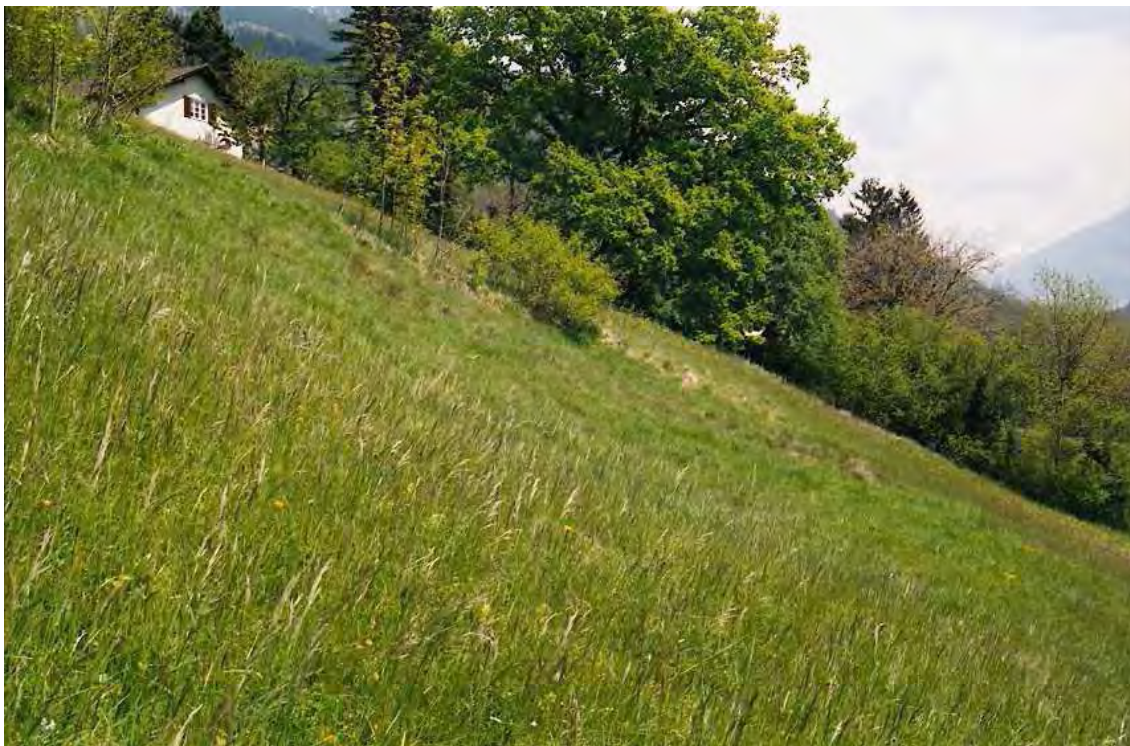
Abbildung 9: Magerwiesen sind nicht nur die „Blumenwiesen“ unserer Landschaft, sie zeichnen sich durch eine große Pflanzenvielfalt und eine reichhaltige Kleintierwelt aus und sind für Vögel, Reptilien und Fledermäuse wichtige Nahrungsräume.

Die Wiese ist an der Geländeböschung unterhalb eines Wohnhauses situiert und weist trotz des leicht angedüngten Zustandes noch die Ausstattung eines Mesobrometum auf.