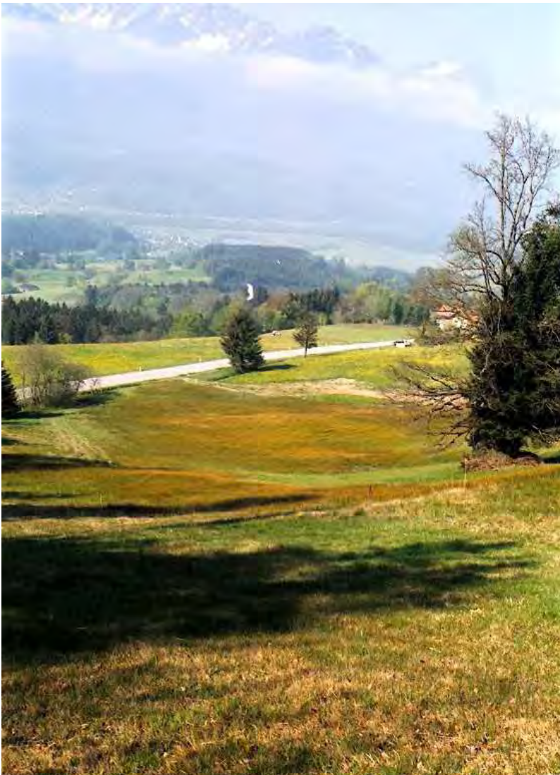
Abbildung 6: Die Riedfläche von Gelda, oberhalb der Straße nach Bassigg mit einem Kopfbinsenried.

Mit dem Biotop Gelda sind drei erhaltenswerte Riedflächen östlich und nördlich von Düns zusammengefasst. Die größte Fläche liegt östlich von Düns, bevor die Straße nach Bassigg in den Wald mündet, oberhalb der Straße. Ein weiteres Ried, ebenfalls östlich von Düns, liegt unterhalb der Straße. Das dritte befindet sich nördlich der Dünser Kirche zwischen zwei Bauernhäusern. Die Hangmoore von Gelda zeichnen sich durch eine artenreiche Flora aus. Dominierende Pflanzenverbände sind das Kopfbinsenried ( Schoenetum nigricantis ) und die Gesellschaft der Stumpfbblütigen Binse ( Juncus subnodulosus ).