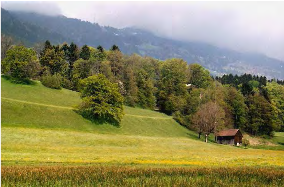
Abbildung 3: Die Magerwiesen von Latura (im Bild am Hang) sind besonders reich an Schmetterlingen, Heuschrecken und Insekten.

Die nördlichste Teilfläche des Biotopes ist die Restfläche eines Mesobrometum, unterhalb einer kleinen Mauer schon eher angedüngt, mit reichlich Zottigem Klappertopf ( Rhinanthus alectorolophus ). Die dritte Teilfläche, eine kleine Einzelfläche ist eine Magerwiesen-Restfläche um eine Gehölzgruppe zwischen Feldwegen.