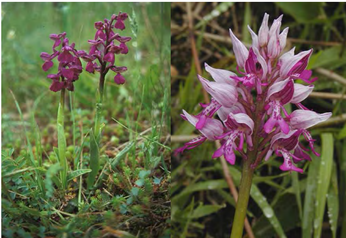
Abbildung 5: Das stark gefährdete Kleine Knabenkraut ( Orchis morio ) und die stark gefährdete Helm-Orchis ( Orchis militaris ), zwei von zahlreichen gefährdeten Arten, die in den Biotopflächen von Montanast und Latura vorkommen.

Oberhalb von Düns liegen beidseitig des Montanastbaches wertvolle Trespenwiesen (Halbtrockenrasen) mit großem Artenreichtum und seltener, großflächiger Kalktuffquellsumpf (Kopfbinsenried). Das Biotop besteht aus vier Teilflächen: zwei kleine Teilflächen befinden sich westlich des Montanastbaches und ein dritte östlich davon. Die vierte Fläche, die stark zerstückelt ist (Eindringen von Intensivlandwirtschaft!), erstreckt sich vom Montanastbach im Westen bis fast zum Schnifisertobel und grenzt im Norden an Wald, im Süden an gedüngte Wiesen. Zwei Pflanzengesellschaften beherrschen das Aussehen der wärmebegünstigten Südhänge: Trespenwiesen (Mesobrometum) und seltener Kalktuffquellsumpf (Schoenetum nigricantis), die sowohl östlich als auch westlich des Montanastbaches nebeneinander zu finden sind. Ferner fällt ein Adlerfarn-Pfeifengras-Bestand auf. Auf den ausgetrockneten Tuffen siedeln sich Trockenheit ertragende Pflanzen an (z.B. Globularia cordifolia ). Das Gebiet mit den wertvollen und seltenen Pflanzengesellschaften und einer Vielzahl bedrohter Pflanzenarten ist durch Intensivierungstendenzen bedroht.