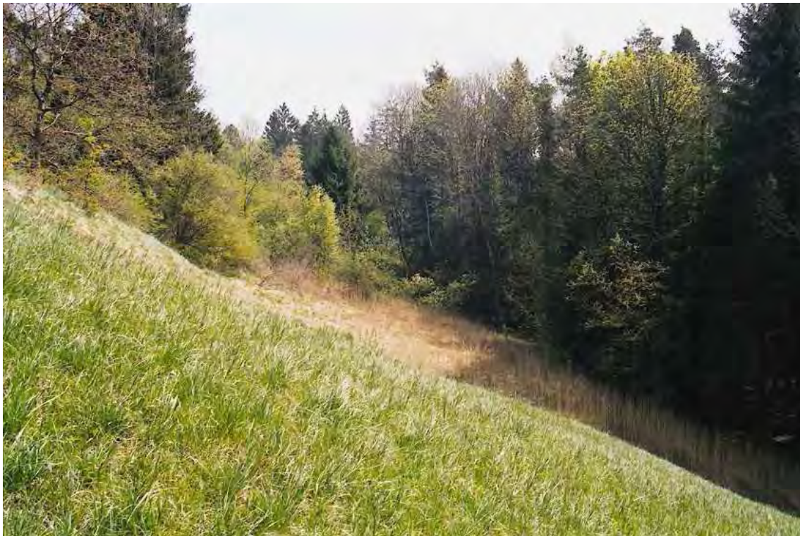
Abbildung 7: Die Biotopflächen von Bildle beherbergen neben Magerrasen auch arten- und struktureiche Waldsäume, die für die Tierwelt besonders wertvoll sind.

Oberhalb und unterhalb der Straße von Schnifis nach Düns bzw. nördlich des Schnifiser Tobels kommen noch Reste von traditionell bewirtschafteten Magerwiesen (Mesobrometen) vor. Es handelt sich überwiegend um Halbtrockenrasen (Mesobrometen) mit örtlich hervortretenden Säurezeigern ( Calluna vulgaris ), bereichert durch ein Kopfbinsen-Hangried ( Schoenus nigricans ). Weiters tritt eine Pflanzengemeinschaft auf, in der das Pfeifengras ( Molinia spec. ) sowie der Adlerfarn ( Pteridium aquilinum ) dominieren. Die Flächen sind als ökologisch wertvolle Übergangszone von intensiver genutzten Flächen zum Waldrand hin durchaus erhaltenswert.