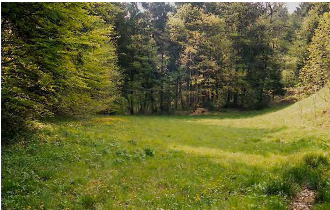
Abbildung 4 Die nördliche der beiden Riedflächen von Blätsch und Jürgaställe. Die zentralen Abschnitte sind noch nährstoffarm mit typischen riedarten.

Das größere der beiden Moore liegt nördlich vom Fußballplatz. Die zweite Moorfläche liegt noch weiter nördlich, durch einen Waldstreifen von der ersten getrennt. Beide Moorflächen grenzen jeweils am unteren Rand an Nadelwald und am oberen Rand an stark gedüngte Wiesen bzw. Weiden.