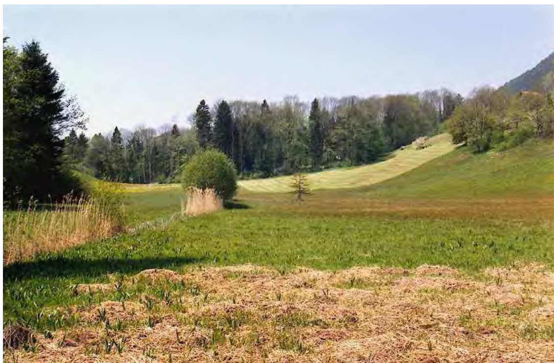
Abbildung 8: Das artenreiche Flachmoor von Pradegoz ist die größte Moorfläche von Düns und von regionaler Bedeutung.

Das artenreiche Moor besteht aus zwei Teilflächen. Die südliche wird von einem alten Torfgraben durchzogen. Sehr nasse Partien tragen hier zur Vielfalt von Kleinlebensräumen (z.B. für verschiedene Libellenarten) bei. Bei den Pflanzenverbänden lassen sich mehrere Einheiten unterscheiden: ein seltenes Zwischenmoor mit der Rostroten Kopfbinse ( Primulo-Schoenetum ferruginei ), die Gesellschaft der Stumpfbütigen Binse ( Juncetum subnodulosi ), Storchschnabel-Mädesüss-Hochstaudenfluren ( Filipendulo-Geranium palustre ) und die Pfeifengraswiese ( Molinietum caeruleae ).