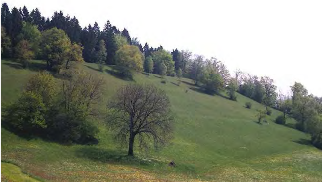
Abbildung 2: Die schöne Kulturlandschaft bei Fuschgel mit artenreichen Halbtrockenrasen und strukturbereichernden Gehölzen.

Die schönen Halbtrockenrasen in südlicher Exposition mit Einzelgehölzen und Baumhecken an den Geländestufen sind auch landschaftlich ungemein reizvoll.