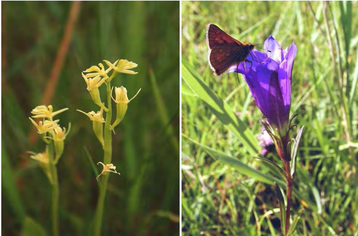
Abbildung 11: Der vom Aussterben bedrohte Glanzstendel ( Liparis loeselii ), eine sehr seltene Orchidee der Flachmoore, links und der stark gefährdete Lungenenzian ( Gentiana pneumonanthe ), eine Charakterart der basenreichen Streuwiesen, rechts