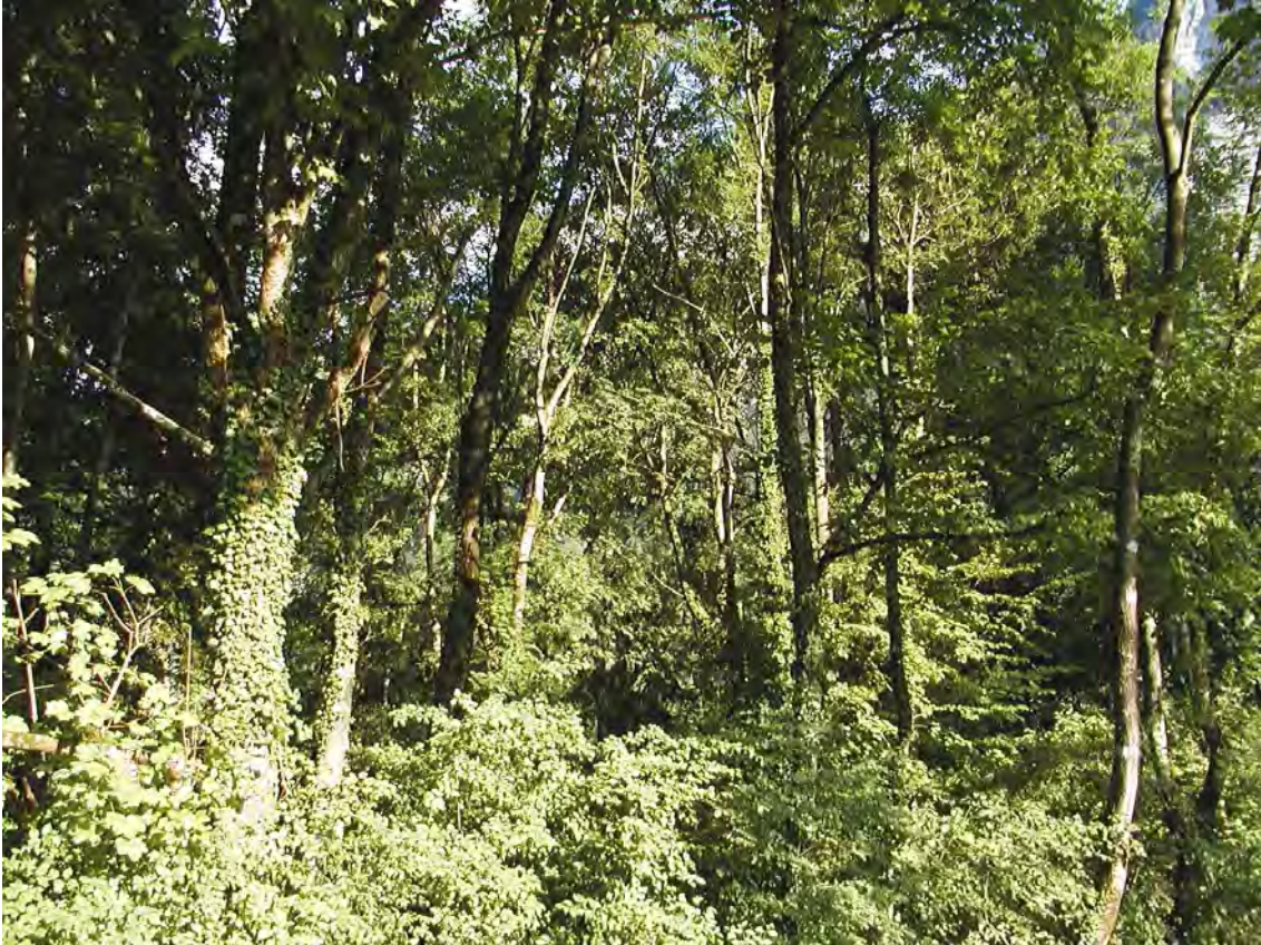
Abbildung 15: Westliche Laubwaldinsel im Biotop Haslach. Efeu wächst bis in die Baumkronen und verleiht dem Bestand einen unwaldartigen Charakter.

Zwischen den beiden Mischwaidinseln erstreckt sich auf einem kalkhaltigen extremen Gley, der sich über dem Bergsturzflügel entwickelt hat, eine größere Streuwiese. Im Wesentlichen handelt es sich um eine Pfeifengras-Streuwiese, die durch Hang-Sickerwasser gespeist wird. Sie ist nicht einheitlich ausgebildet und zeigt etwa folgenden Aufbau: