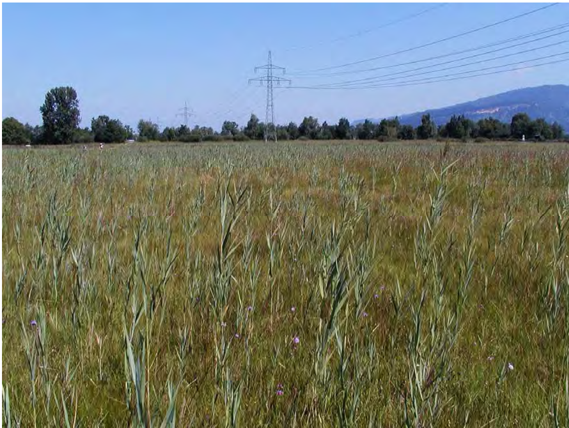
Abbildung 10: Die ausgedehnten Kopfbinsen-Rieder im Bereich Schwarzes Zeug.

Durch die besondere Lage im Überschwemmungsbereich beim Zusammenfluss der Dornbirnerache und den Molassebächen und den damit verbundenen spezifischen Böden (torfige, episodisch überflutete- früher regelmäßig überflutete- Mineralböden) beherbergt das Gebiet den seltensten Riedtyp im Rheintal. Durch den Kontakt zum Auwald des Achmäanders, den Gräben und der teilweisen, aber nicht zu starken, Verbuschung ist das Gebiet zusätzlich reich durchmischt und daher besonders vielfältig.