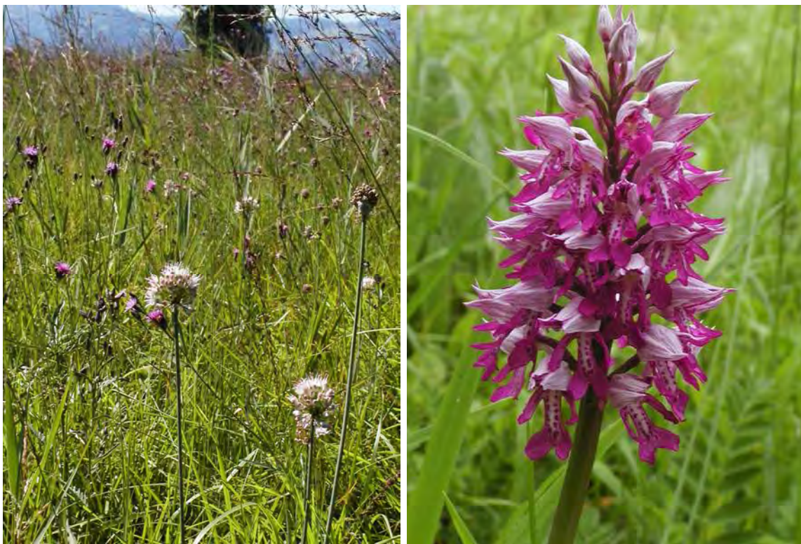
Abbildung 7: Links: artenreiche Pfeifengraswiesen mit dem vom Aussterben bedrohten Duftlauch ( Allium suaveolens ) und der gefährdeten Färber-Scharte ( Serratula tinctoria ); rechts das gefährdete Helm-Knabenkraut ( Orchis militaris ).

Westlich der Autobahn dominiert ein relativ gut erhaltener Komplex aus basenarmen (Junco-Molinietum) und basenreichen Streuwiesen (Allio suaveolentis-Molinietum). An der südlichen Gemeindegrenze gehen die Bestände in schilffreie Brachen über. Die Pflanzendecke der nördlichen Riedparzellen besteht im Wesentlichen aus eher basenarmen Pfeifengraswiesen, mit schönen Populationen des Duftlauchs ( Allium suaveolens ) und Wechselfeuchtezeigern wie Echem Labkraut ( Galium verum ). Die Streuwiesen an der Schweizer Straße werden vorwiegend von niedrigem und hohem Pfeifengras ( Molinia caerulea und M. arundinacea ) und Schilf ( Phragmites australis ) dominiert. Gegen die Autobahn gelangt die Spitzblütige Binse ( Juncus acutiflorus ) zur Vorherrschaft. Durch die unmittelbare Nachbarschaft des großen Riedes bei Gsieg/Lustenau besitzen die Streuwiesen auch eine große Bedeutung als Teillebensraum und Brutgebiet für die bedrohte Riedfauna, im Besonderen für Riedvögel (Braunkehlchen, Schafstelze, Feldschwirl, Kiebitz, Rohrammer, Baumpieper, Bekassine, Großer Brachvogel).