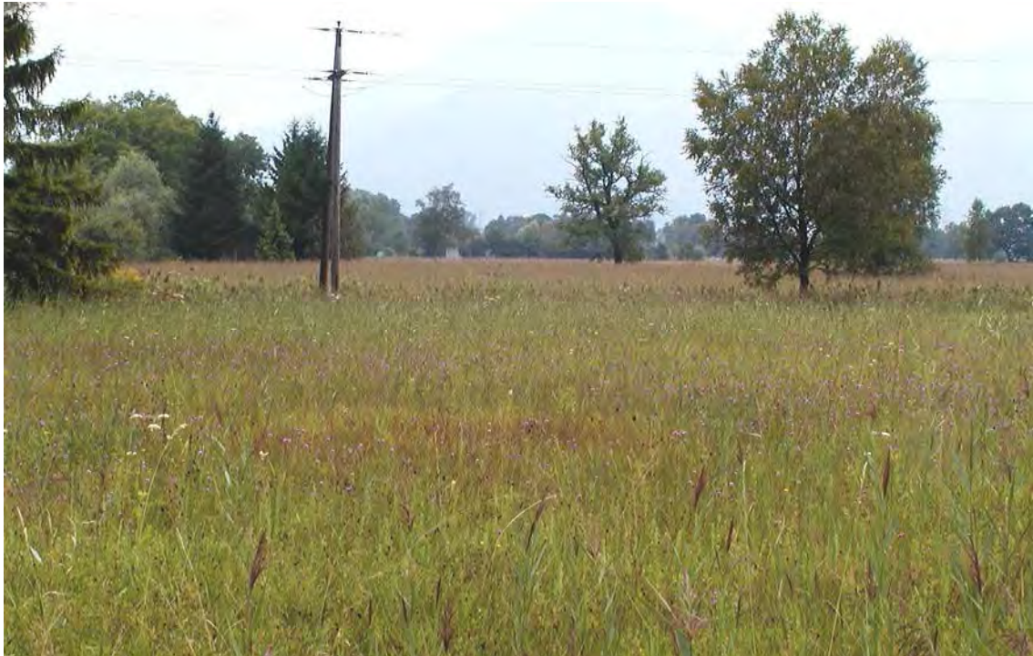
Abbildung 8: Ausgedehnte bodensaure Streuwiesen in Gleggen.