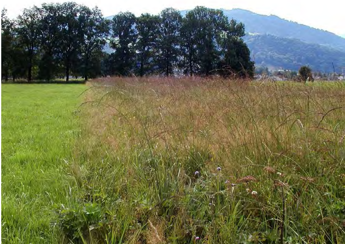
Abbildung 13: Hochwüchsige Pfeifengraswiesen im Haselstauder Ried.

In den östlichen Riedparzellen ist das Hohe Pfeifengras ( Molinia arundinacea ) wesentlich am Bestandaufbau beteiligt. In den hohen und dichten Pfeifengraswiesen dominieren neben den beiden Pfeifengrasarten vor allem Mädesüß ( Filipendula ulmaria ), Sumpf-Storchschnabel ( Geranium palustre ) und Schilf. Die Dominanz der nährstoffbedürftigen Hochstauden weist auf die Nährstoffanreicherung durch die angrenzenden Fettwiesen wider. Die Wassergräben zwischen den Riedparzellen sind mit dichten Rasen der Sumpfsegge ( Carex acutiformis ) und vereinzelt Horsten der Steifsegge ( Carex elata ) verwachsen. Im Frühjahr stehen diese Großseggensümpfe lange unter Wasser und fallen durch das Gelb der blühenden Sumpfdotterblumen auf. Die nährstoffreichen Böschungen der Wassergräben werden von Mädesüß- Hochstaudenfluren besiedelt.