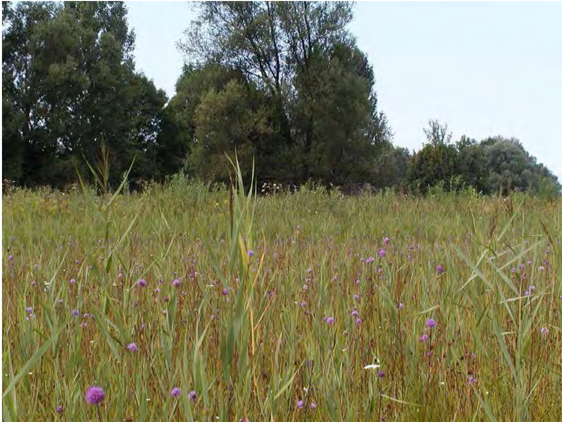
Abbildung 9: Leicht verschilfte Streuwiesen mit reichen Beständen des Teufelsabbiss ( Succisa pratensis ).