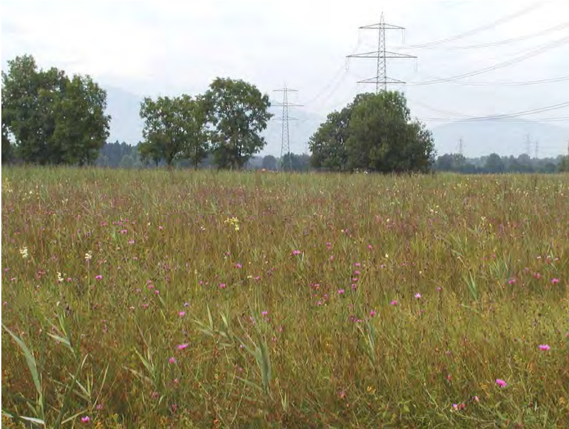
Abbildung 3: Größerflächige Pfeifengras-Streuwiesen am Landgraben.