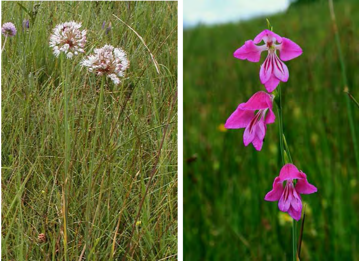
Abbildung 5: Die beiden vom Aussterben bedrohten Arten Duftlauch ( Allium suaveolens ), links und Sumpf-Gladiole ( Gladiolus palustris ), rechts, im Bereich Böschen.