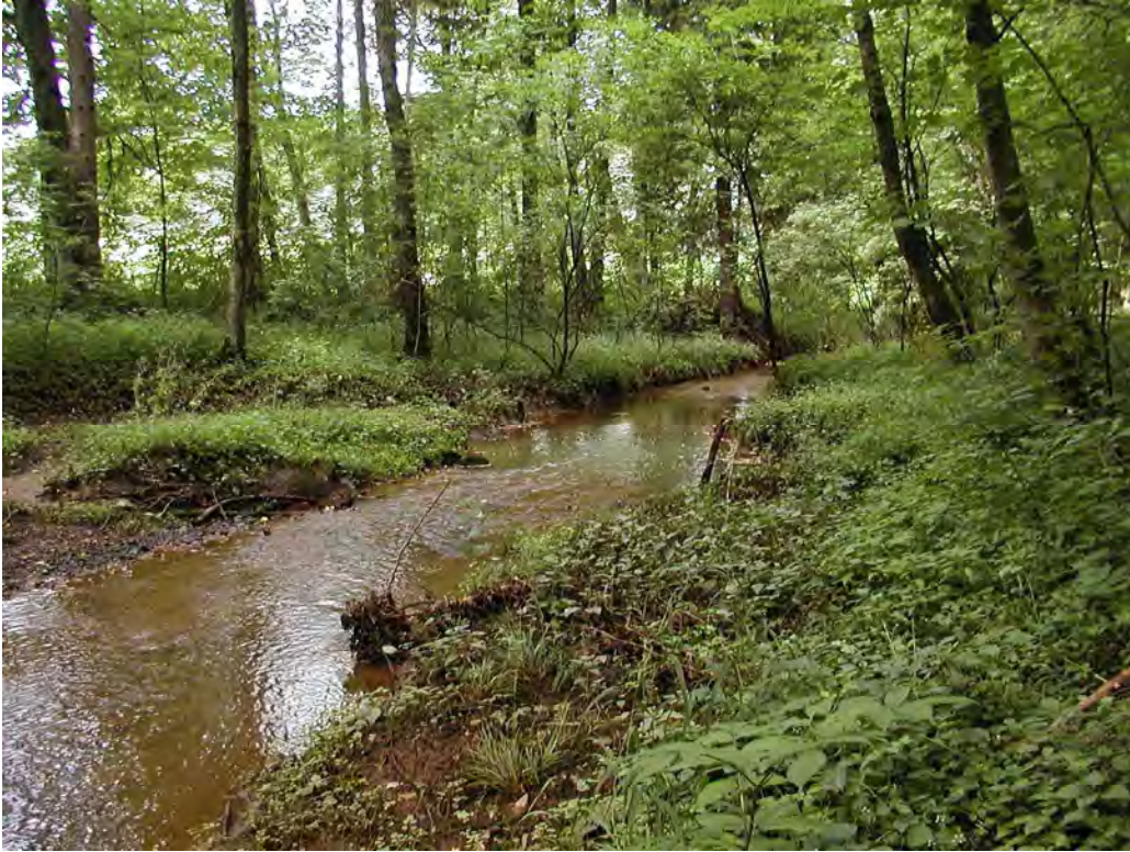
Abbildung 14: Auwald am naturbelassenen Mühlgraben.