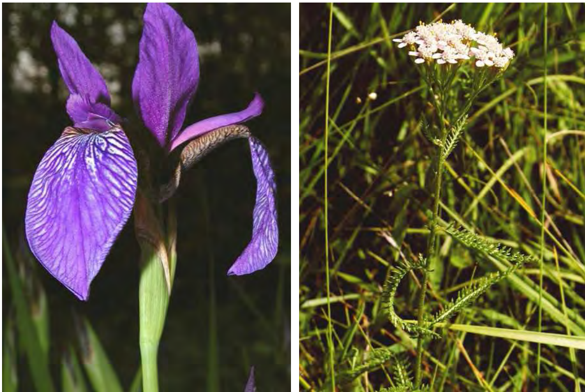
Abbildung 6: Die stark gefährdete Sibirische Schwertlilie ( Iris sibirica ), links und die gefährdete Blassrote Schafgarbe ( Achillea roseo-alba ), rechts, in den Streuwiesen von Gsieg.

Die Fläche wird von relativ trockenen, basenarmen Streuwiesen dominiert. Die zentrale Riedfläche wird durch einen in Ost-West- Richtung verlaufenden Feldweg in zwei Hälften geteilt. Südlich des Weges sowie im westlichen Bereich gegen die Autobahn dominieren relativ trockene, binsenreiche Pfeifengraswiesen (Junco-Molinietum) in denen lokal Bestände der Sumpfschilf (Carex acutiformis) eingestreut sind. Die Bereiche nördlich des Weges werden von einer lichten mittelhohen Pfeifengraswiese eingenommen mit Vorkommen der Sumpfsiegwurz (Gladiolus palustris). Der Boden ist ein wechselfeuchter kalkhaltiger Gley, der im Sommer gelegentlich austrocknet, wodurch einige Wechselfeuchenzeiger wie Kiellauch (Allium carinatum) und Echtes Labkraut (Galium verum) häufig auftreten. Die isolierten Riedparzellen im Süden bestehen aus schilfreichen Pfeifengraswiesen, in denen neben dem Pfeifengras (Molinia caerulea) auch das Hohe Pfeifengras (Molinia arundinacea) dominiert.