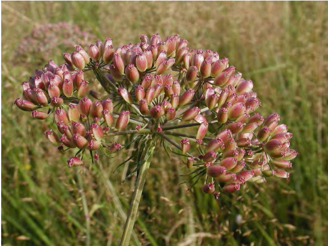
Abbildung 4: Fruchtstand des gefährdeten Sumpf-Haarstranges ( Peucedanum palustre ).