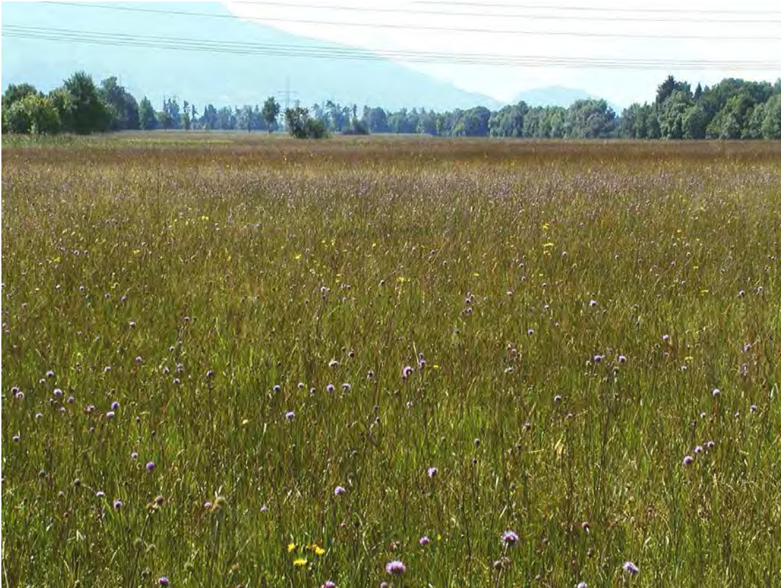
Abbildung 2: Die ausgedehnten, bodensauren und niederwüchsigen Streuwiesen im Bereich Gleggen.