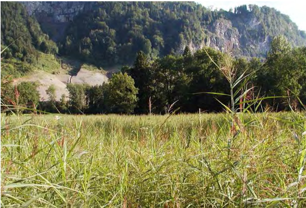
Abbildung 16: Die Streuwiese im Biotop Haslach ist ein wichtiges Refugium für zahlreiche gefährdete Tier- und Pflanzenarten.

Die Streuwiesen sind die letzten Reste der ehemaligen Wallenmäher Feuchtwiesen. Als Zeugen der traditionellen Bewirtschaftung und als Lebensraum von zahlreichen gefährdeten Arten der Streuwiesen müssen auch sie grundsätzlich als schutzwürdig bezeichnet werden.