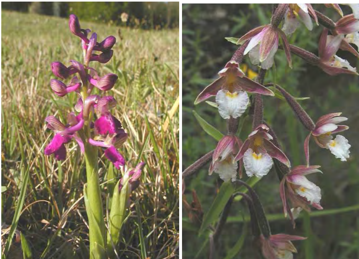
Abbildung 12: Das stark gefährdete Kleine Knabenkraut ( Orchis morio ), links und der gefährdete Sumpf-Stendel ( Epipactis palustris ), rechts, zwei typische Orchideen basenreichen Streuwiesen und Flachmoore.

Landschaftlich gegliedert wird der Feuchtbiotopkomplex durch einen Saumwald aus Grauerlen, verschiedenen Weiden und vereinzelt Eschen entlang des Haselstauder Baches, zerstreuten Gebüschern sowie durch einen weitgestreuten Baumbestand mit teils mächtigen Silberweiden. Im östlichen Teil werden die Streuwiesen durch zwei Baumalleen, in denen Eichen ( Quercus robur ) und Birken ( Betula pendula ) dominieren, gegliedert.