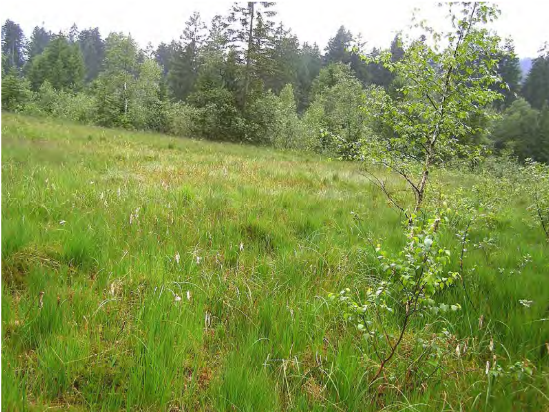
Abbildung 2: Zentraler Hochmoorteil mit Bulten und Schlenken sowie Vorkommen von Moorbirken ( Betula pubescens ).