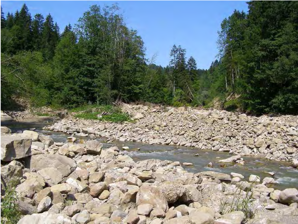
Abbildung 6: Die Weißach im Bereich der Einmündung des Badgrabens.