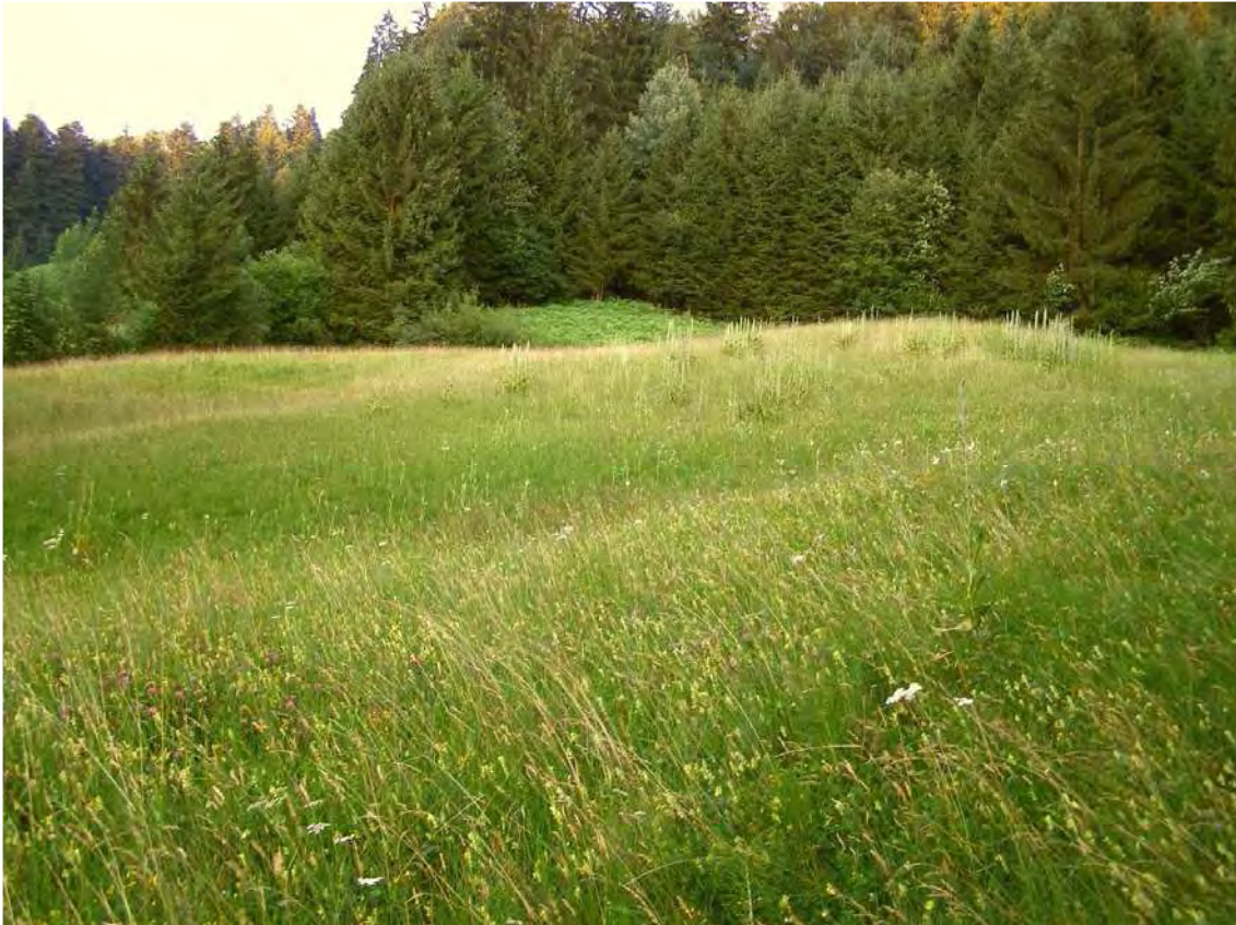
Abbildung 4: Magerwiesen bei Rotach.