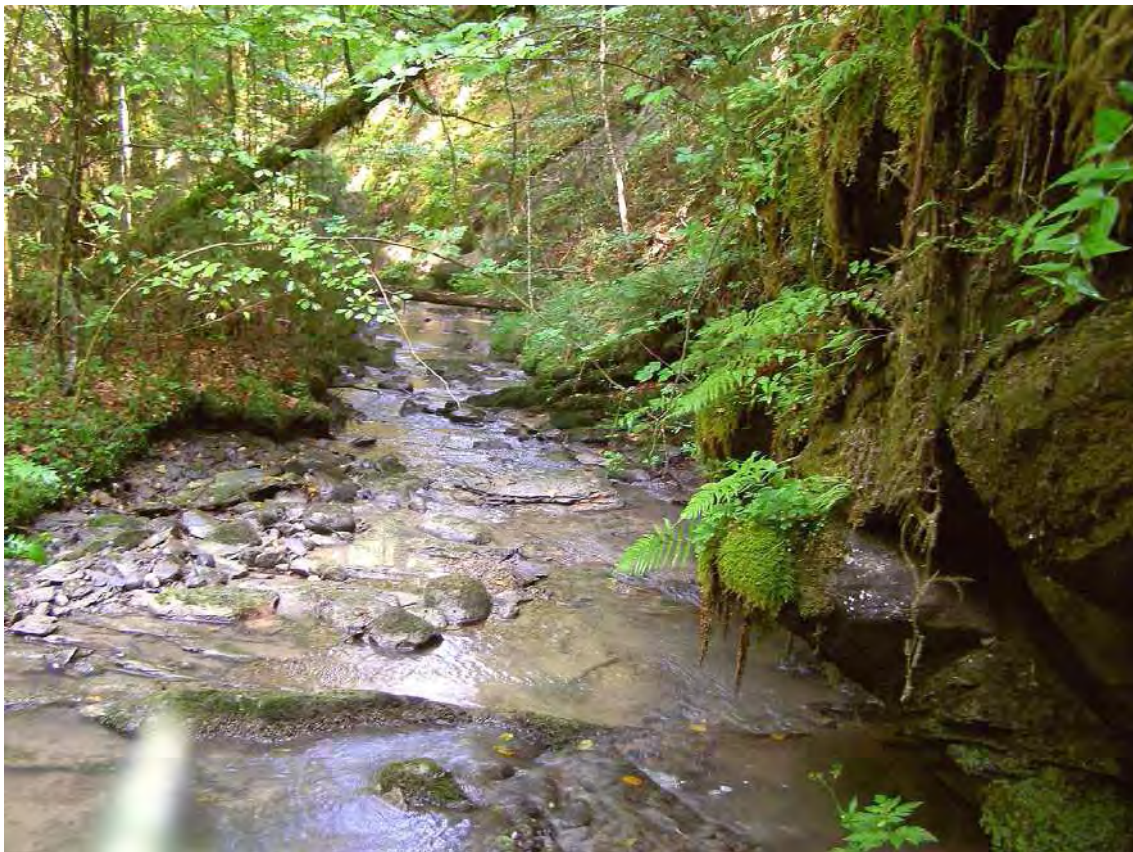
Abbildung 9: Unterer Verlauf des Sägabaches mit Anrissen und Windungen.

Der Sägabach fließt fast durchgehend im Waldbereich und entspricht einem Molassebach von weitgehender Ursprünglichkeit. Als Bach der granitischen Molasse zeigt er eine typische Reliefierung und ist entsprechend geröllarm (kleine Kolke in Schichtfugen, glatte und steile Rinnen etc.). Er wird max. bis zu 3m breit. Die Einmündung in die Rotach erfolgt über eine Art treppigen Wasserfall.