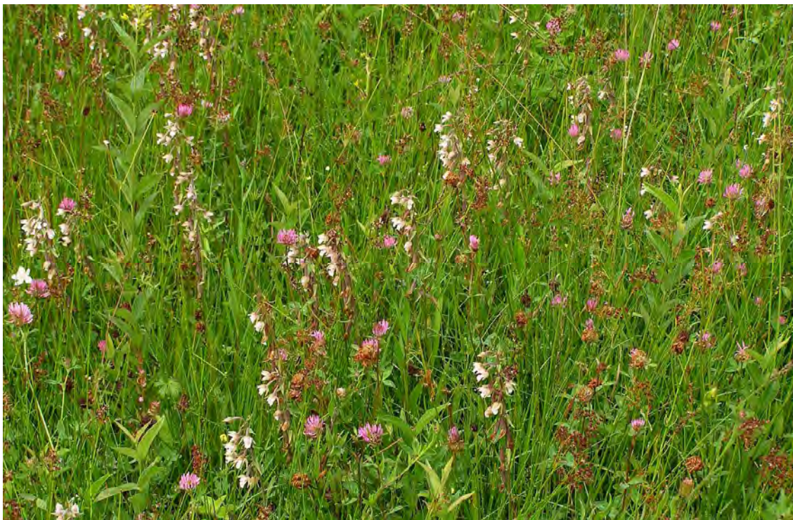
Abbildung 7: Flachmoor mit reichen Beständen der Sumpf-Stendelwurz ( Epipactis palustris ).

In einer kleinen Sattelverebnung gelegenes, teilentwässertes Flachmoor, welches von der Vegetation her teils einer Pfeifengraswiese ( Molinietum caeruleae ), teils einem Davallseggenmoor ( Caricetum davalliana ) entspricht. In den Randbereichen zu den umliegenden Wirtschaftswiesen ist eine Mädesüß-Hochstaudenflur ( Filipenduletum ) ausgebildet. Fundort seltener und gefährdeter Arten (diverse Orchideen, Trollblume etc.). In der Hangmitte wird das Flachmoor durch eine Baumhecke mit Esche, Eiche, Buche, Zitterpappel, Schwarzerle, Fichte und Birke unterteilt, wodurch der Bestand als ganzes auch ein landschaftlich sehr reizvolles Ensemble bildet.