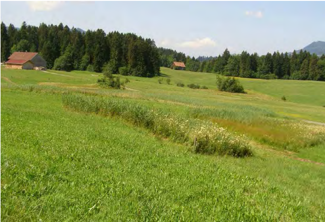
Abbildung 8: Hangmoor an der Straße bei Rotach.

Nördlich der Bundesstraße bei Rotach finden sich mehrere kleine Streuwiesen, bei denen es sich um die Reste eines einstmals weit größeren Hangflachmoors handelt. Von der Vegetation her entsprechen sie großteils Pfeifengraswiesen ( Molinietum caeruleae ), teilweise mit reichlich Schilf, teils Davallseggenrieden ( Caricetum davallianae ) und Bachdistelwiesen ( Cirsietum rivularis ). Randlich treten auch Mädesüß-Hochstaudenfluren ( Filipenduletum ) auf. In einer Hangmulde, in welcher auch die westlichste Streuwiesenfläche liegt, fließt ein kleiner, teils mäandrierender und von Schwarzerlen gesäumter Wiesenbach. Bemerkenswert ist auch das Vorkommen der im Gebiet ansonsten nicht anzutreffenden Sibirischen Schwertlilie ( Iris sibirica ).