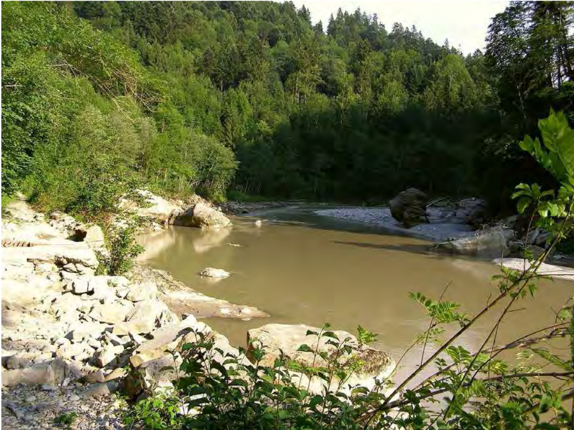
Abbildung 3: Die Bregenzerach im Bereich Nellenburg, flussabwärts mit Fichten-Tannen-Buchenwäldern und Hanggrauerlenwäldern.