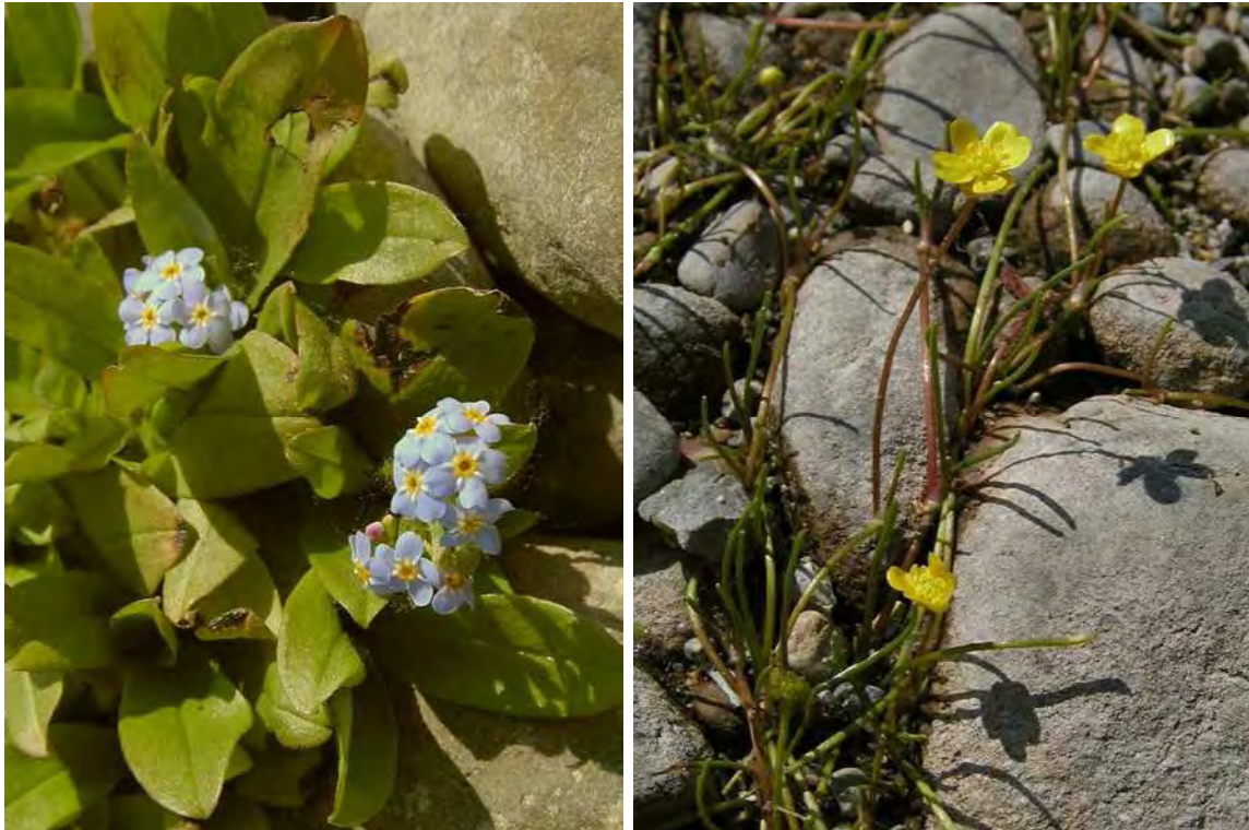
Abbildung 7: Die beiden charakteristischen vom Aussterben bedrohten Arten der schottrigen Bodenseeufer. Links das Bodensee-Vergissmeinnicht ( Myosotis rehsteineri ), rechts der Ufer-Hahnenfuß ( Ranunculus reptans ).

Das Biotop umfasst den Uferstreifen seewärts des Strandweges zwischen Sport- und Yachthafen bei der Mehrerauer Jagdhütte. Die typische Strandvegetation ist hier noch weitgehend natürlich erhalten geblieben. Auf einen grobschotterigen Strandwall folgen mehr oder minder von offenem Wasser abgeschirmte Lagunen mit kräftigem Schilfröhricht ( Phragmitetum australis ) und schwimmende Teichlinsendecken ( Lemno- Spirodeletum polyrhizae ). Um die Badehütte und östlich davon sind den Röhrichten Grenzzonenbiotope vorgelagert mit Strandlingsvegetation ( Eleocharidetum acicularis ) und Strandschmielengesellschaft ( Deschampsietum rhenanae ), mit einer guten Population des Bodensee-Vergissmeinnichts ( Myosotis rehsteineri ) und auch einigen Horsten der Strandschmiele ( Deschampsia rhenana ). Im zentralen Teil der Fläche liegt am Weg zur Badehütte eine alte Eichenallee.