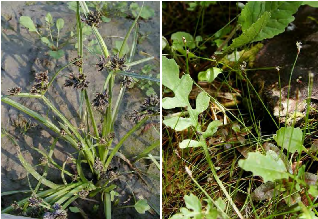
Abbildung 17: Die beiden vom Aussterben bedrohten Arten der Schlammlingsfluren, links das Braune Zypergras ( Cyperus fuscus ) und rechts das sehr unscheinbare und winzige Nadel-Sumpfried ( Eleocharis acicularis ).