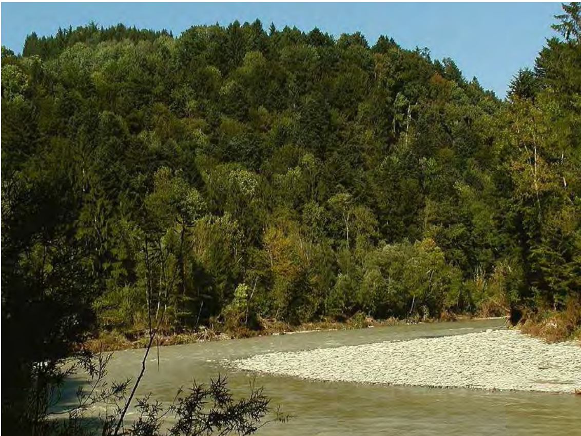
Abbildung 15: Bregenzerache mit Schotterbänken und den edellaubreichen Buchenwäldern an den Hängen.

Der Bregenzer Anteil der Ach-Schlucht wird von steilen Buchenwäldern dominiert (Asperulo-Fagetum), die in feuchten Hangnischen bzw. bei Quellaustritten in Ahorn-Eschenbestände übergehen. An flachgründigen Hangversteilungen tritt die Eibe hinzu (Taxo-Fagetum). Im Auebereich der Bregenzerach sind einerseits kleinflächige Grauerlenauen (Calamagrosti-Alnetum) sowie an selten überschwemmten Standorten auch Hartholzauen (Querco-Ulmetum) entwickelt. Am Ufer selbst sind nur kleinere Schotterbänke entwickelt, die große Schotterfläche im östlichsten Teil der Fläche gehört bereits zur Gemeinde Buch. Bemerkenswert sind die relativ großen Bereiche mit Kalktuffquellen etwa 300m westlich des Rickenbaches. Das Biotop entspricht nur einem kleinen Abschnitt der ausgedehnten Bregenzerachschlucht.