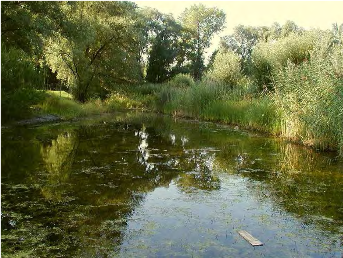
Abbildung 8: Der Feuchtgebietskomplex beim Bilgerihafen.