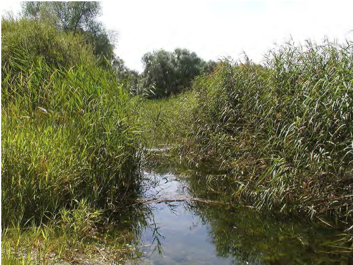
Abbildung 6: Schilfumstandene Bereiche des Flöschenbachs mit Wasserpflanzen und Ufervegetation.

Beim Flöschen- oder Kalten Bach handelt es sich um einen der Mehrerauer Gießbäche, die durch die Eintiefung der Bregenzerache und infolge diverser flussbautechnischer Maßnahmen den Großteil ihrer Wasserführung verloren haben. Trotzdem muss der Bach noch als schutzwürdiger Biotop betrachtet werden, da der Bach selbst, aber auch die umgebenden Röhrichte und Gebüschgalerien eine wertvolle Ergänzung zur Naturlandschaft des gesamten Gebietes darstellen. Im Mündungsbereich ist eine typische Schlammlingsflora entwickelt.