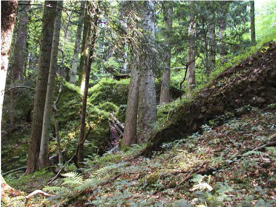
Abbildung 4: Bestandesbild eines tannenreichen und stark verblockten Bereichs der Pfänderwälder.