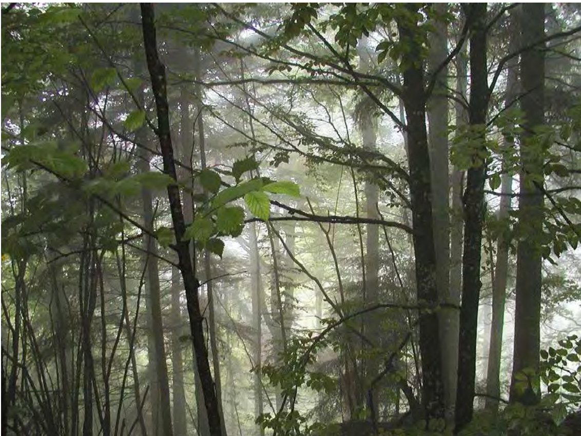
Abbildung 16: Die buchenreichen Wälder des Wirtatobel im Nebel.

Das Wirtatobel ist als eines der großen Molassetobel zwangsläufig ein aus der Sicht des Biotopschutzes bemerkenswertes Gebiet. Der Rickenbach, der das Tobel durchfließt, ist als Molassebach mit permanenter Wasserführung zu charakterisieren, wobei größere und kleine Molasseblöcke (Konglomerate, Sandstein) das Bachbett verfüllen und gliedern. Die Schluchthänge sind mit Ausnahme höherer Felsstufen bewaldet, wobei auf den steilen Hangrippen ein eibenreicher Buchen-Tannen-Fichtenwald ( Asperulo odoratae -Fagetum) stockt, der zu den Unterhängen hin in eschenreichere Bestände übergeht ( Carici-remotae Fraxineten und eschenreiche Ausbildungen des Asperulo odoratae -Fagetum). Bemerkenswert sind sickerfeuchte Hangpartien, die von Grauerlen eingenommen werden. Der Bestand ist trotz seiner Unzugänglichkeit nur mäßig totholzreich. Schluchtwälder und Bach präsentieren sich in einem naturnahen bis weitgehend ursprünglichen Zustand. Der östliche Teil des Tobels liegt in der Gemeinde Langen bei Bregenz (Biotopnummer 22211).