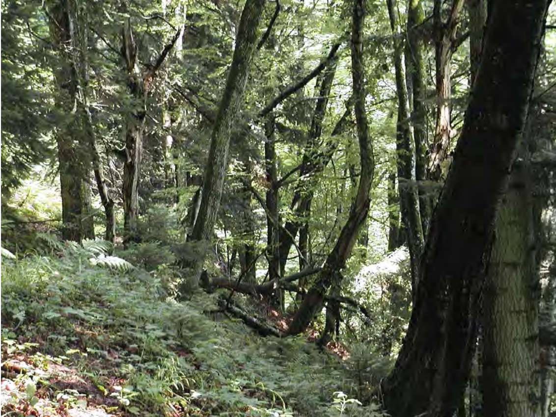
Abbildung 11: Bestandesbild der urwaldartigen Bestände der wärmeliebenden Laubmischwälder oberhalb Fluh.