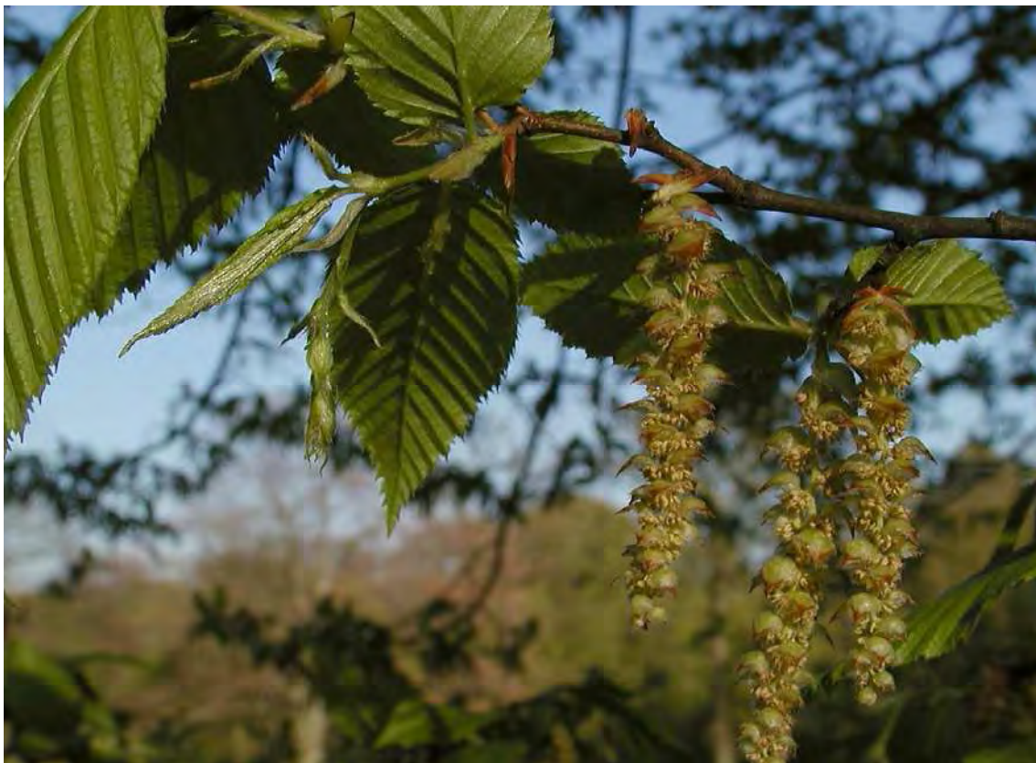
Abbildung 9: Die wärmeliebende und in Vorarlberg gefährdete Hainbuche ( Carpinus betulus ) ist die bestimmende Art im Eichen-Hainbuchenwald des Erawäldele.

Das direkt im Stadtgebiet von Bregenz liegende Erawäldele stellt einen weitgehend natürlichen Laubmischwald mit hervorragendem und vielfältigem Baumbestand dar. Es ist eines der wenigen Beispiele der natürlichen Waldentwicklung in den nicht vernässten Tieflagen um Bregenz. Das Biotop wurde als Naturwaldreservat ausgewiesen. Mächtige Individuen mit durchwegs 50-100 cm Brusthöhendurchmesser bilden eine vielfältige und eindrucksvolle Baumschicht. Strauch- und Krautschicht sind je nach Waldrandnähe und Durchforstung einmal dichter, dann wieder sehr spärlich. Das Erawäldele muss als Reliktwald verstanden werden, der eine Vorstellung des ursprünglichen bzw. des potentiellen Waldbildes vermittelt. Der Wald ist in ökologischem Sinn als Trittstein zwischen Achwald, Mehrerauer Wäldern und Pfänderwäldern zu sehen.