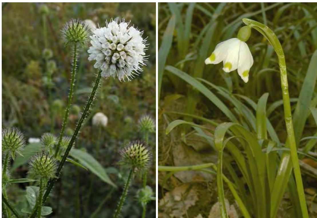
Abbildung 13: Die beiden stark gefährdeten Arten Borsten-Karde ( Dipsacus pilosus ) in einer verbrachten Streuwiesenfläche am Rand des Weges zum Berghotel Fluh, links im Bild sowie die Frühlingsknotenblume ( Leucojum vernum ) an den Waldrändern.

Am Ende des Känzeleweges, etwas westlich unterhalb des Berghotels "Fluh" liegt eine vernässte Mulde mit stark verbrachten Flachmoorentwicklungen, wobei durch den innigen Kontakt zu den randlich gedüngten Wirtschaftswiesen vorwiegend Eutrophierungszeiger vorherrschen, z.B. Rispensegge ( Carex paniculata ), Waldbinse ( Scirpus sylvaticus ), Mädesüß ( Filipendula ulmaria ), viel Sumpfdotterblume ( Caltha palustris ) etc. Nach Osten wird das Flachmoor durch einen Graben entwässert, an dem sich unter anderem ein Rohrkolbenbestand entwickelt hat ( Typha latifolia ) und den Gebüsch (Faulbaum - Frangula alnus , Ohrchenweide - Salix aurita ) begleiten. Ausgenommen kleinerer Vernässungen im Gebiet von Hochwacht und Stollen ist dieser Flachmoorkomplex der einzige in der weiteren Umgebung und deshalb grundsätzlich schutzwürdig, wenn auch die starke Verbrachung und Verschilfung des Bestandes die Wiederaufnahme der Streunutzung dringend angeraten erscheinen lässt.