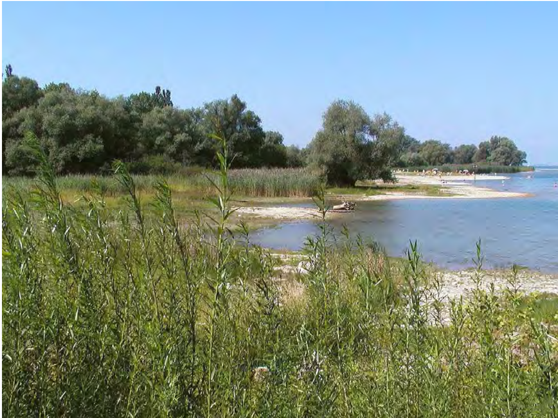
Abbildung 3: Blick auf die kiesreichen Uferzonen des Brachsenloch mit Standorten des Bodensee-Vergissmeinnicht.

Grenzzonenbiotope (Überflutungszone) am Bodensee und Röhrichte sowie ein schmaler Auwaldstreifen der den Bestand gegen Süden abschließt. Im Biotop befindet sich die größte Population des Bodensee-Vergissmeinnichts am Bregenzer Seeufer. Die Fläche ist von internationaler Bedeutung! Zwischen Yachthafen und westlicher Liegewiese zieht sich in Form einer kleinen Bucht ein ca. 50 m langer natürlicher Uferstreifen hin. Die Vegetationsgürtelung entspricht im Frühjahr (April/Mai) dem Schema, wie es für oligotrophe sandig-kiesige Uferpartien bekannt ist. Seeseitig auf eher schluffig-sandigen Flächen beginnt die Zonierung mit Strandlingsrasen ( Eleocharidetum acicularis ) oder in Abflussrinnen mit der Quellgrasflur ( Ranunculetum scelerati ), auf die im feinkiesigen, etwas später überfluteten Bereich die endemische Strandschmielengesellschaft ( Deschampsietum rhenanae ) mit einer relativ individuenreichen Population des Bodensee-Vergissmeinnichts ( Myosotis rehsteineri ) folgt. Landeinwärts wird die Strandschmielenflur von Kriechrasen ( Rorippo-Agrostietum ) und schließlich dem Schilfröhricht abgelöst ( Phragitetum australis ), welches schließlich in einen Weißweidenauwald übergeht. Die Standorte des Bodensee-Vergissmeinnichts werden seitlich durch den Damm zum Yachthafen einerseits, andererseits durch ein meist überflutetes Röhricht begrenzt.