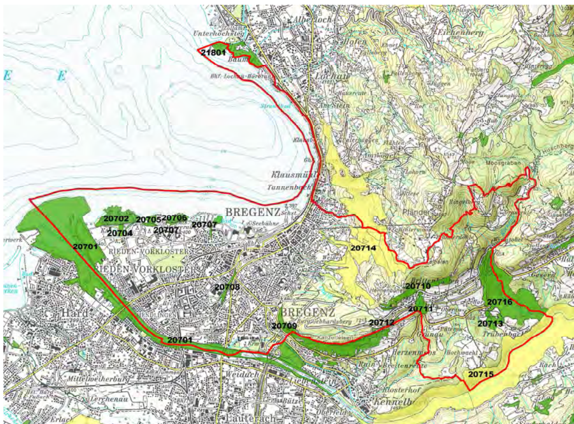
Abbildung 1: Lage der Biotopflächen in der Gemeinde Bregenz. Gelb: Großraumbiotop. Grün: Kleinraumbiotop.

Sämtliche Biotop - wie auch alle Schutzgebiete des Landes - finden Sie auf der Homepage des Landes Vorarlberg unter www.vorarlberg.at/atlas .