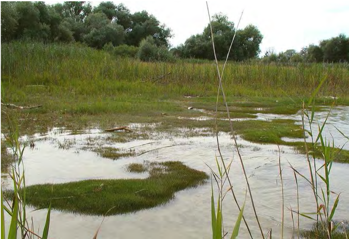
Abbildung 2: Blick auf die Strandlingsfluren mit Littorella uniflora in den Überschwemmungsbereichen des Bodenseeufer.

Einige mächtige Einzelexemplare kennzeichnen besonders die ufernahen Teile. Besonders bemerkenswert ist die Entwicklung von Hartholzauen aus Heckenbeständen. In der gesamten Fläche treten zahlreiche gefährdete Arten auf, von denen einige nur auf das Bodenseeufer beschränkt sind.