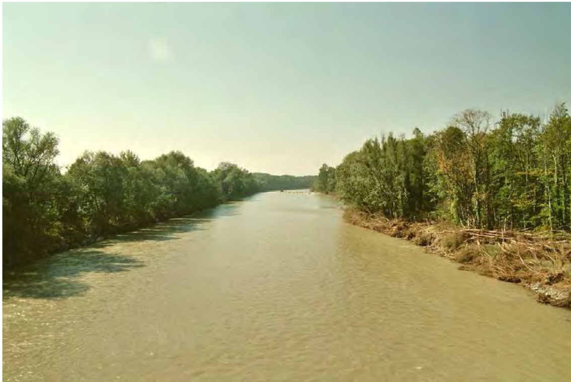
Abbildung 5: Die Bregenzerache mit ihren umgebenden Auwäldern an der Brücke nach Lauterach. Blick nach Westen.