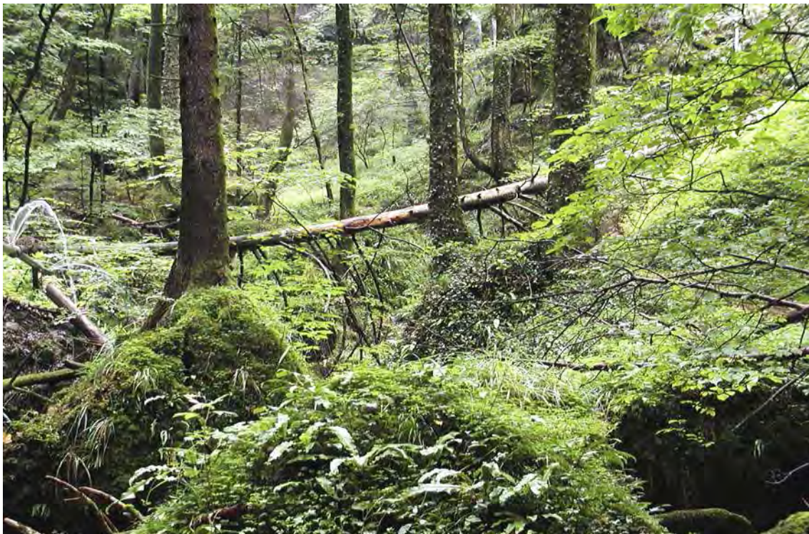
Abbildung 12: Bestandesbild des tannenreichen Buchenwaldes am St. Wendelinstobel.

Die Wasserfallbiotope sind je nach Spritzwassereinfluss recht unterschiedlich gegliedert, von trockenen, fast vegetationsfreien Überhängen bis zu dauernassen, eigentlichen Wasserfallbiozönosen mit Algenüberzügen und Moosfluren.