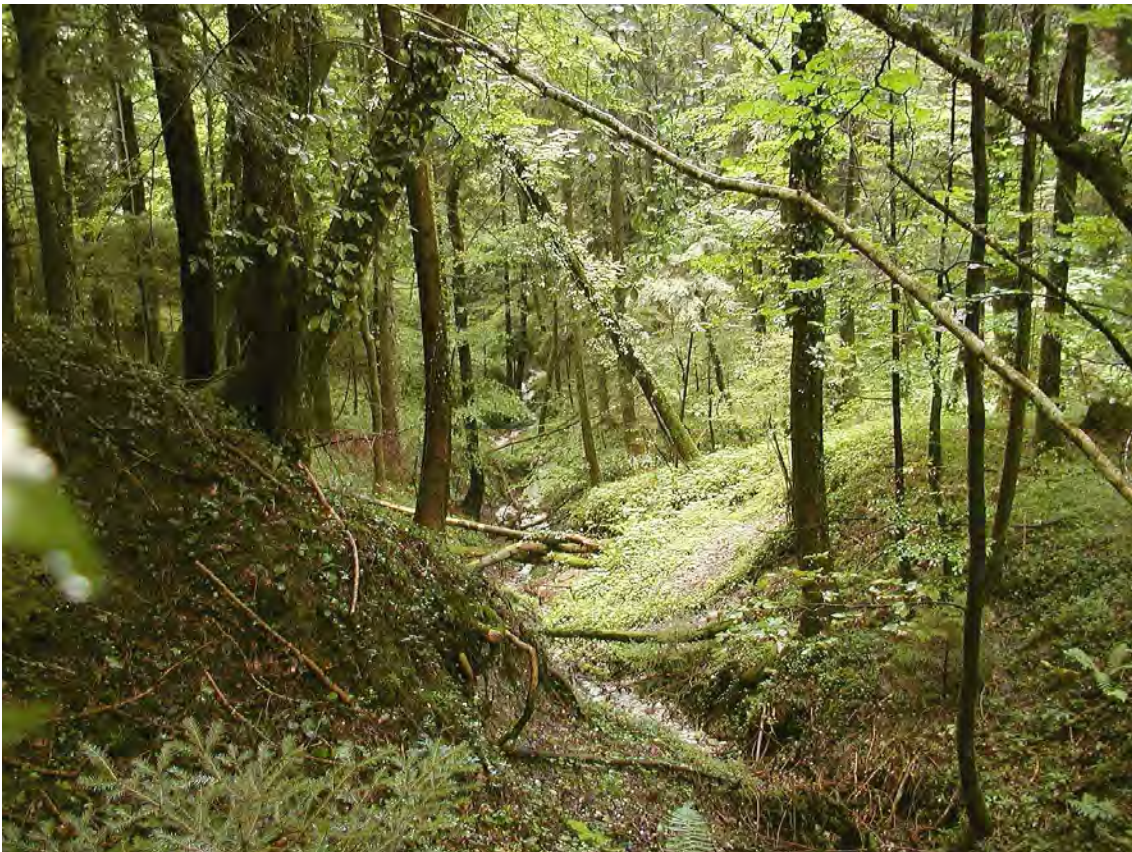
Abbildung 14: Bestandesaufnahme des tannenreichen Ahorn-Eschen-Tobelwaldes bei Trübenbach.

Schöner Bachtobel mit begleitenden tannenreichen Wäldern auf versumpftem Boden mit kleinen Quellfluren und einem schilfreichen Grauerlen-Sukzessionswald. Die Eschen-Ulmen-Hangwälder ( Aceri-Fraxinetum ) zeigen eine reiche Tannenverjüngung und gehen nach Osten in tannenreiche Buchenwälder über ( Asperulo-Fagetum ). Im Norden liegt eine größere Schlagfläche mit Hochstauden, die von jungen Eschenbeständen umgeben ist. Im Bestand liegen kleinere Quellfluren mit Starknervmoos ( Cratoneuron commutatum ) und Schilfflächen mit einzelnen Grauerlen. Bei den Quellwäldern handelt es sich um lokal spezifische Waldtypen auf Laufletten, die zumeist durch Quellfassungen verändert sind.