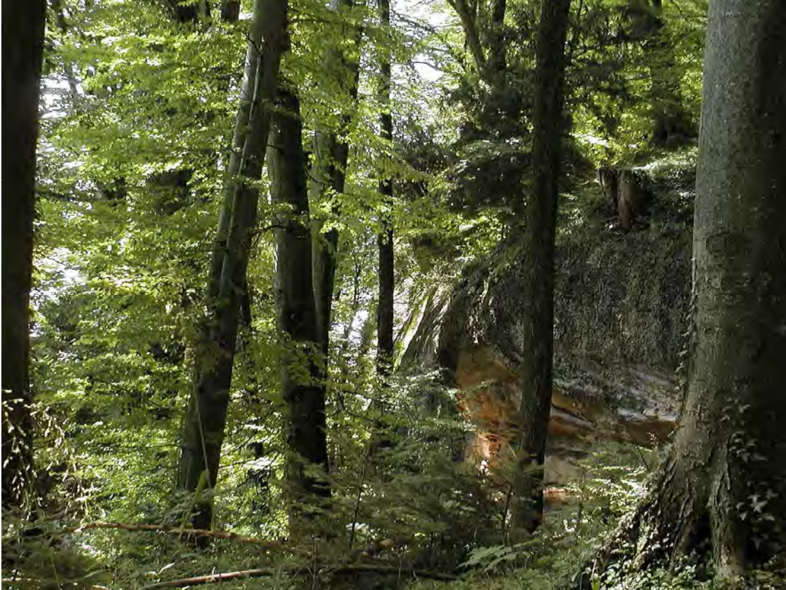
Abbildung 10: Bestandesbild des eibenreichen und wärmegetönten Waldes am Gebhardsberg.