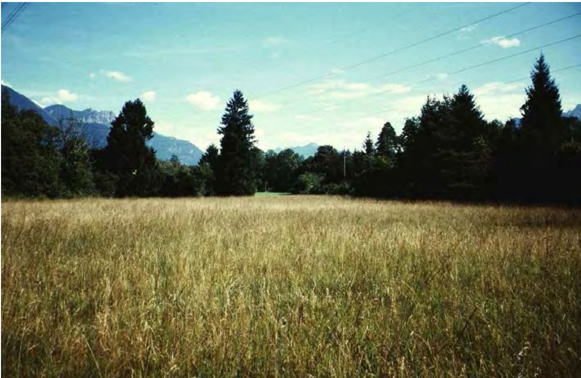
Abbildung 3: Sehr artenreiche Kernfläche ( Molinietum wechselfeucht bis trocken) des Gaisriedle südlich von Gais. Blick nach Südosten.

Das Gaisriedle liegt zwischen dem Siedlungsgebiet von Gais und den Waldungen der Bludescher Au und ist aufgrund seines Artenreichtums und des sehr guten Erhaltungszustands das bedeutendste Biotop des Kulturlandes im Talboden der Gemeinde Bludesch. Es handelt sich um einen kompakten Streuwiesenkomplex mit einem ausgeprägten Wechsel feuchter und trockener Standortverhältnisse und dementsprechend vielfältiger Vegetation (u.a. Selino-Molinietum, Ansätze zum Juncetum subnodulosi, zum Caricetum davallianae und Übergänge zum Mesobromion). Der Florenbestand ist von regionaler Bedeutung.