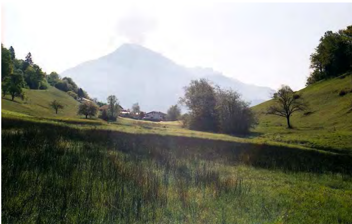
Abbildung 12: Das Biotop Oberried zeichnet sich durch eine reichhaltige Riedflora aus.

Die Vegetation ist durch die menschliche Tätigkeit (Torfabbau in früherer Zeit wohl bis 1900) deutlich verändert worden. Die abgetorften Bereiche werden nun von einer Pfeifengraswiese (Molinietum) eingenommen. Auch schlenkenartige Strukturen, in denen der Fieberklee ( Menyanthes trifoliata ) vorkommt, sind noch im westlichen Teil vorhanden. Allgemein sehr reichhaltige Riedflora.