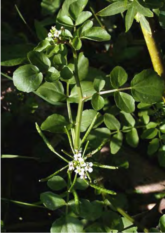
Abbildung 5: Die echte Brunnenkresse ( Nasturtium officinale ), eine typische Art klarer Gewässer.