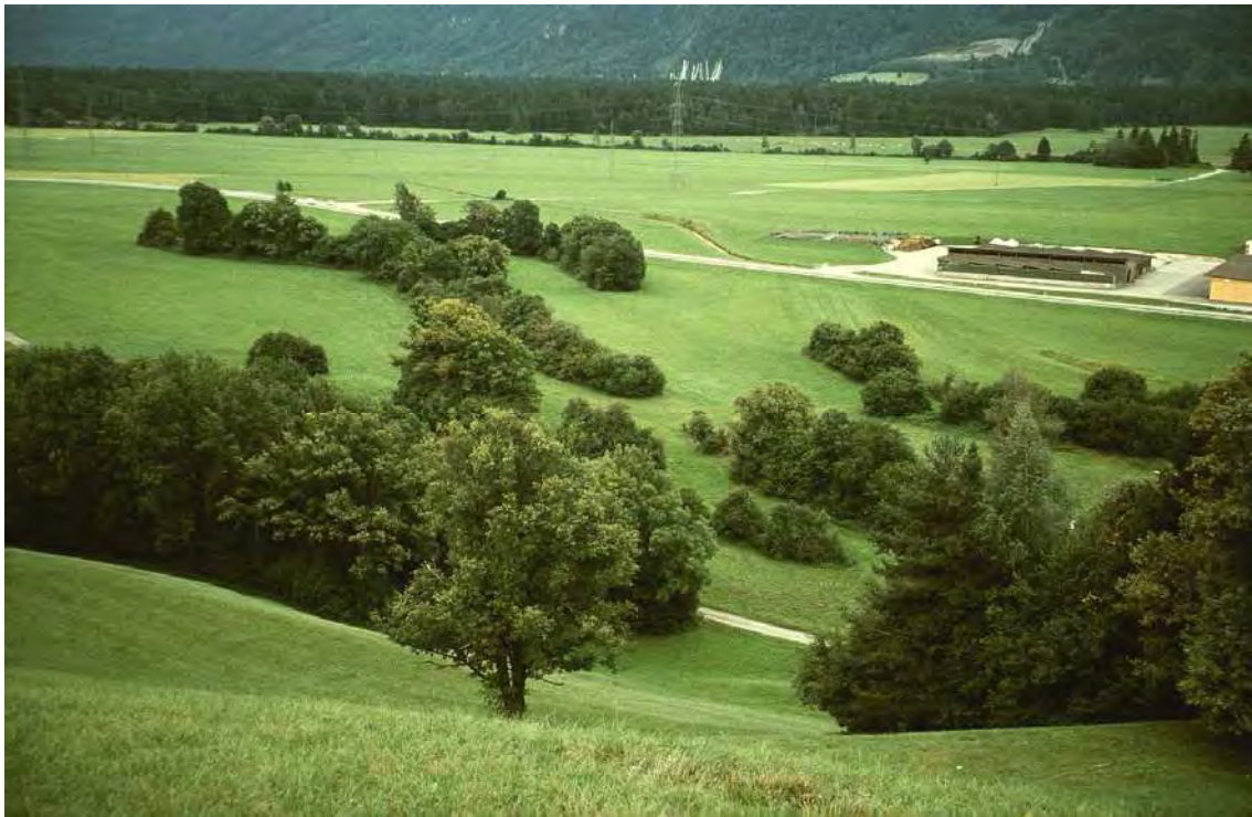
Abbildung 7: Die Wallheckenlandschaft von Bludesch-Hägi.

Die parallel, entlang der Grundstücksgrenzen verlaufenden Heckenzüge, werden im Wesentlichen von Stieleiche ( Quercus robur ) und Esche ( Fraxinus excelsior ) aufgebaut, daneben ist Feldahorn ( Acer campestre ) reichlich vertreten. Die Strauchschicht ist äußerst vielfältig und teilweise mantelartig vorgelagert, ebenso wie Reste von Trespenwiesen, thermophilen Säumen und artenreichen Glatthaferwiesen.