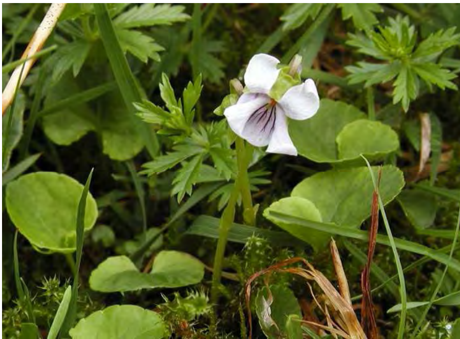
Abbildung 9: Das gefährdete Sumpf-Veilchen kommt in den Streuwiesen von Eggwald vor.

Im alten Torfstich im Turbastall ist ein Weiher künstlich aufgestaut. Der Weiher weist dichte Rasen von Wasserlinsen ( Lemna minor ) auf. Große Bedeutung hat der Weiher als Laichplatz für Erdkröten ( Bufo bufo ) und Grasfrösche ( Rana temporaria ); weiters konnten Bergmolch ( Triturus alpestris ) und Ringelnatter ( Natrix natrix ) sowie verschiedene Libellenarten (u.a. Cordulegaster spec. ) in der näheren Umgebung festgestellt werden.