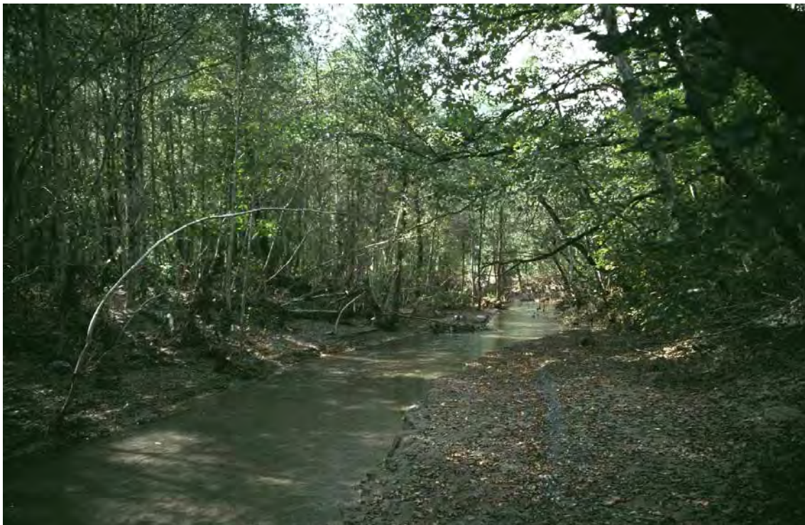
Abbildung 8: Winkelseggen-Eschenwald mit stärkerer Beteiligung der Grauerle. ( Carici remotae-Fraxinetum ) am Ufer des Klazbaches.

Bei den ausgewiesenen Wäldern handelt es sich um einen Winkelseggen-Eschenwald mit stärkerer Beteiligung der Grauerle. ( Carici remotae-Fraxinetum ). Sehr naturnah sind die Auwaldbestände innerhalb der alten Illabdämmung (Dammbauten) im Mündungsbereich des Klazbach in die Ill, es handelt sich um zur Silberweidenau vermittelnde Grauerlenwälder. Sie sollten gänzlich außer Nutzung gestellt und eine Naturwaldzelle eingerichtet werden.