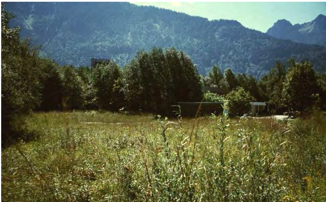
Abbildung 2: Verbrachte, teils ruderalisierte Pfeifengraswiesen ( Selino-Molinietum ) und verschilfte Mädesüßfluren ( Filipendulo-Geranietum ) westlich der Straße Nenzing-Gais (Autobahnabfahrt).

Letzte, inzwischen inmitten des Siedlungs- und Gewerbegebiets von Bludesch-Gais gelegene Relikte eines einst ausgedehnten und reich verzahnten Streuwiesen- und Auwaldkomplexes des Unteren Illsands nördlich des Autobahnknotens Gais. Einige Teilflächen sind floristisch noch recht reichhaltig und stellen Refugialräume für eine Reihe von gefährdeten Riedwiesenarten dar. Die Flächen liegen im ehemaligen Überschwemmungsgebiet der Ill, indem sich Flussschotter und Sande abgelagert haben. Es handelt sich bei diesem Biotop um Restflächen ehemals ausgedehnter Pfeifengras-Streuwiesen, vor allem des Selino-Molinietum.