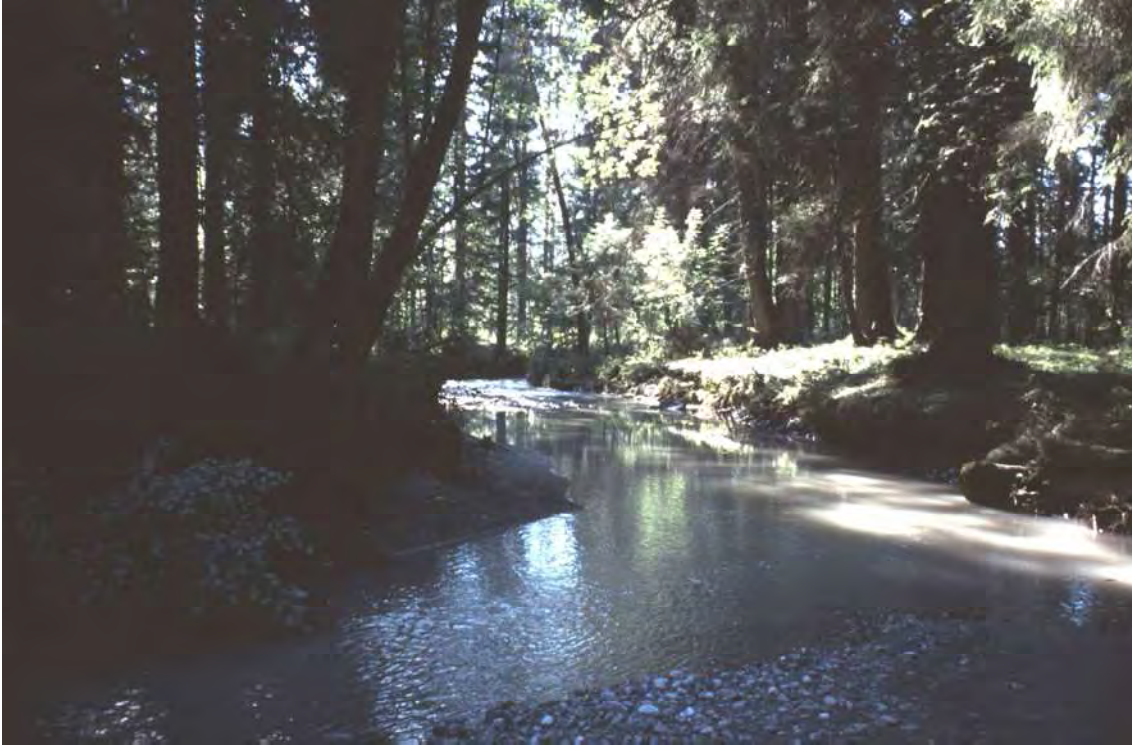
Abbildung 4: Der Dabalada Bach an seinem naturnahen Abschnitt unterhalb der Dotierungsstelle der Kraftwerksausleitung der Lutz.