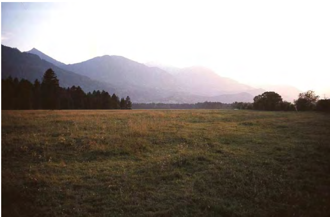
Abbildung 13: Magerweiden der Bludescher Allmein. Am rechten Bildrand ist die Hecke erkennbar, welche sich wie die Viehweiden etwa einen Kilometer weit nach Westen zieht.

Das Biotop umfasst die nördlichsten Teile der Viehweiden der Bludescher Allmein und wird von artenreichen Magerweiden eingenommen, die in Bezug auf ihre Vegetationsausstattung und Größe im Walgauer Talboden als einzigartig anzusehen sind. Sie entsprechen im wesentlichen mageren Kammgras-Rotschwingelrasen die komplexhaft mit Beständen bzw. Übergängen zu wärmeliebenden Kalkmagerrasen durchsetzt sind. Im Norden wird die Allmein von einer mehr als einen Kilometer langen, ökologisch und landschaftsstrukturell höchst bedeutsamen Hecke begrenzt. Die Hecke (Teilfläche 04) zeigt einen zweistufigen Aufbau und ist ausgesprochen artenreich. Ihre Baumschicht wird von Stieleiche ( Quercus robur ), Esche ( Fraxinus excelsior ) und Kirsche ( Prunus cerasus ) gebildet. Die dominante und hochwüchsige Strauchschicht beherbergt zahlreiche Beeresträucher wie etwa Schlehe ( Prunus spinosa ), Kreuzdorn ( Rhamnus cathartica ), Berberitze ( Berberis vulgaris ) und Wolligen Schneeball ( Viburnum lantana ).