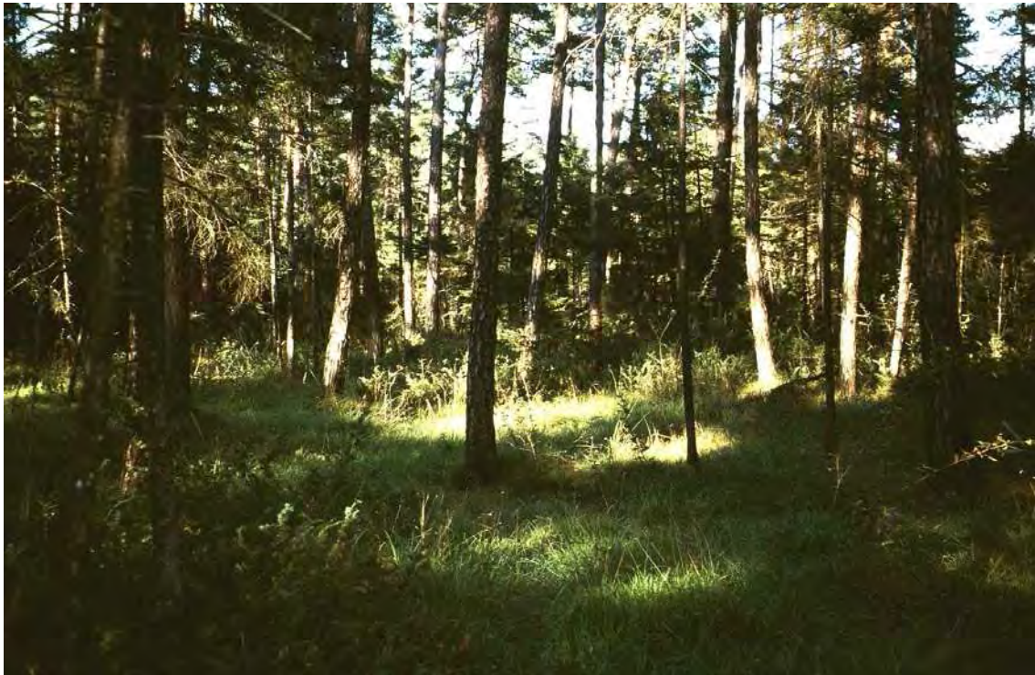
Abbildung 14: Rotföhren-Trockenauwald des Lutzwaldes.

Außerordentlich artenreiche, teils extrem schwachwüchsige Rotföhren-Trockenauwälder (Dorycnio-Pinetum) auf den Schottern des Lutzschwemmkegels zwischen dem Werkskanal im Norden und der Lutz im Süden. Die Bestände zählen sicher zu den schönsten Beispielen dieses Waldtyps im Walgauer Talboden. Auf den flachgründigsten und trockensten Standorten handelt es sich um lichte, schwachwüchsige, nur maximal fünf Meter hohe Krüppelwälder aus Rotföhre und Fichte. Bemerkenswert ist die artenreiche Strauchschicht die von Wacholder, Lavendelweide und Berberitze dominiert wird. Auch der von Gräsern dominierte Unterwuchs ist ausgesprochen artenreich entwickelt und beherbergt die typischen Föhrenwaldarten.