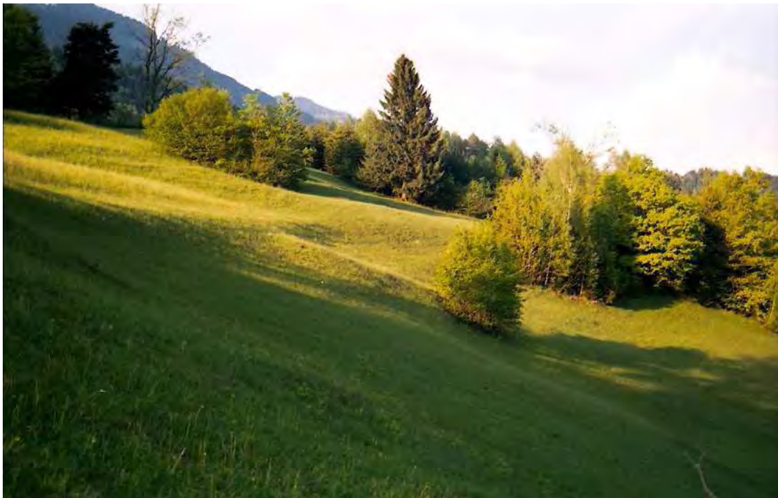
Abbildung 10: Blick in die reichhaltige Kulturlandschaft der Bludescher Magerwiesen (Naturschutzgebiet).

Es lassen sich verschiedene Variationen des Trespen-Halbtrockenrasens (Mesobrometum) im Gebiet feststellen. Neben mesophilen Ausbildungen können an flachgründigen Standorten ausgesprochene Trockenheitszeiger festgestellt werden (z.B. Globularia punctata , Polygala chamaebuxus , Teucrium chamaedrys ). Auf Versauerung des Bodens weist etwa Calluna vulgaris hin. Ausgesprochene Hangvernässungen lassen kleinflächig eine völlig andere Pflanzengesellschaft entstehen, z.B. Kopfbinsenried ( Schoenetum ).