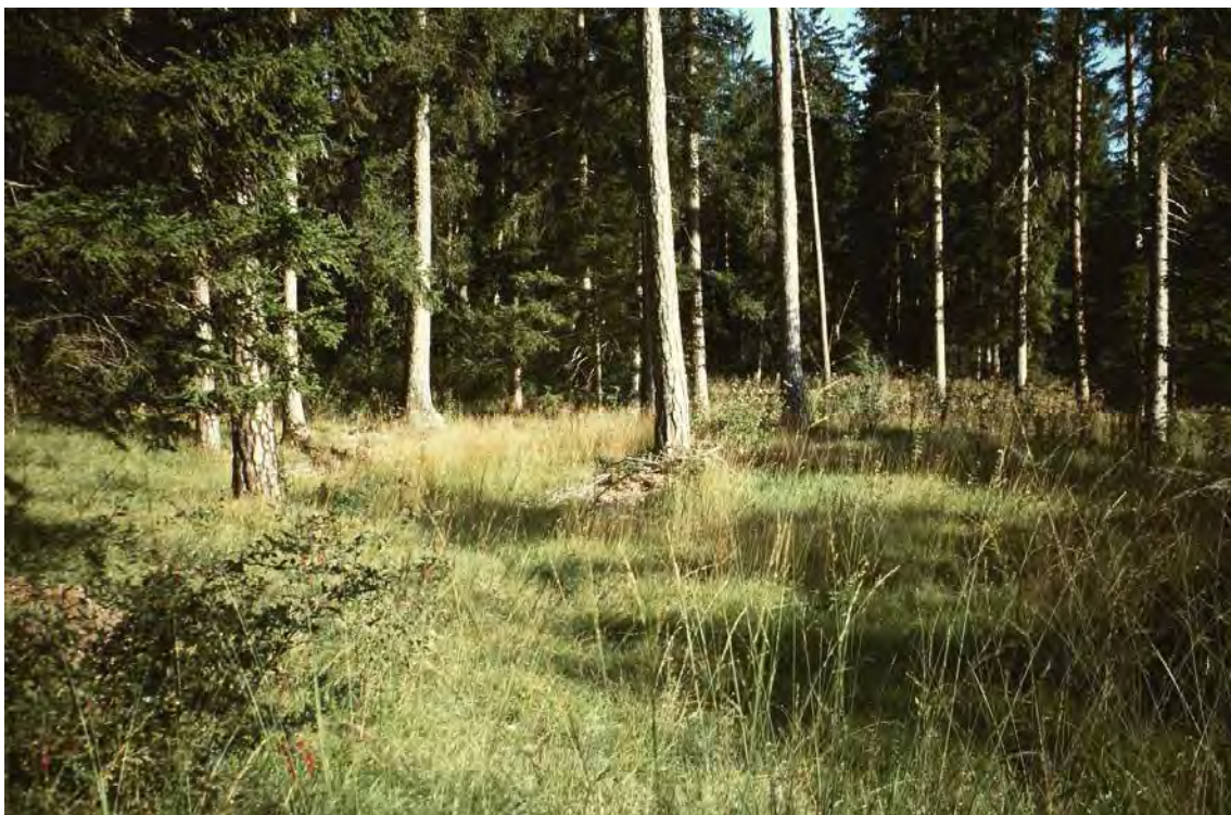
Abbildung 6: Ehemals beweideter Rotföhren-Trockenauwald der Bludescher Au.

Die inventarisierten Bestände sind Teil der ausgedehntesten Waldfläche des Walgauer Talbodens auf dem mächtigen Lutz-Schuttkegel südwestlich von Bludesch.