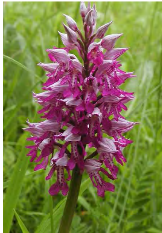
Abbildung 11: Die seltenen Orchideen Fliegen-Ragwurz ( Ophrys insectifera )- links und Helm-Knabenkraut ( Orchis militaris ) rechts, zwei der vielen gefährdeten Pflanzen, die in den Bludescher Magerwiesen vorkommen.